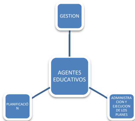
Gráfico N° 1: Centralización de los Sistemas Educativos Latinoamericanos

Existen diferentes formas de definir la gestión dependiendo del modelo del cual proviene dicha definición o el acento que se coloque en los objetivos de la organización, la comunicación, los sujetos y la distribución de los recursos.