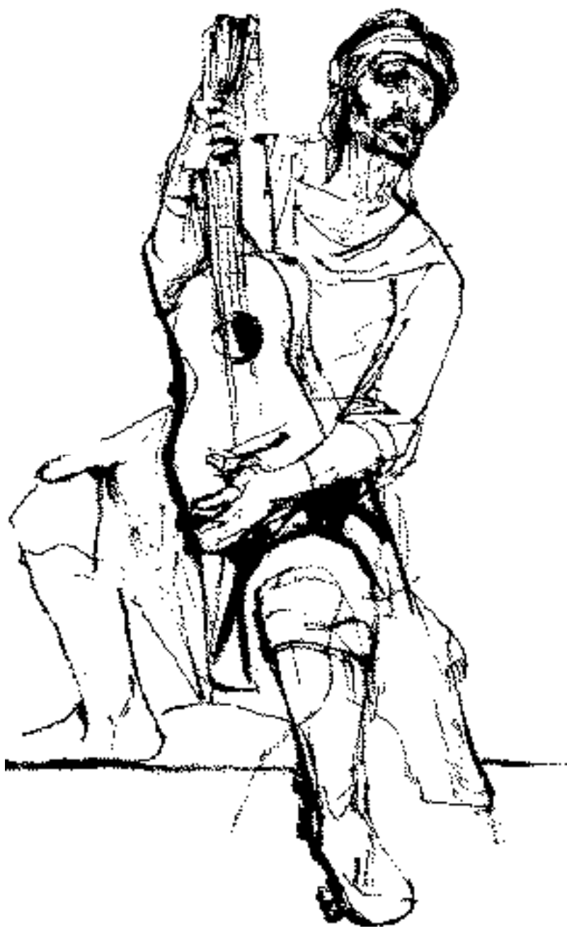
Ilustración: Juan C. Castagnino