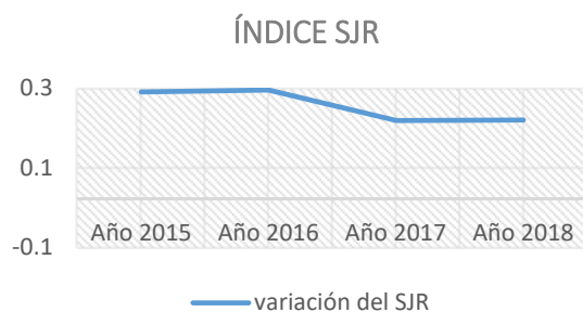
Fig. 1. Representación gráfica del SJR en la revista seleccionada. Elaborado por los autores.

En la siguiente figura (Fig. 1) mostramos cómo podría comportarse el SJR para la revista en el año 2018.