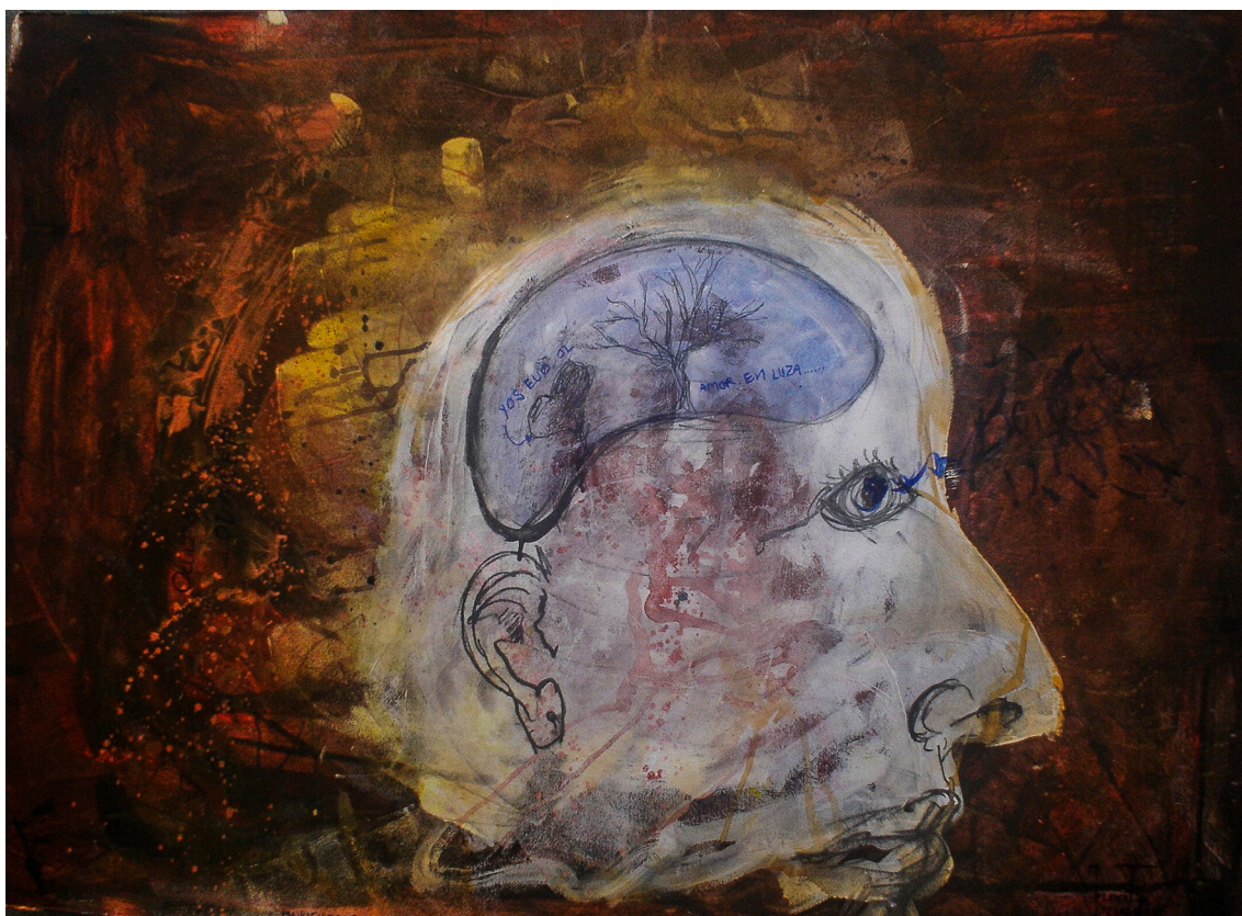
Muriendo bajo mis sefac ocultas , de la serie Faces ocultas (2006). Técnica mixta sobre papel: Elena Fabela. Prohibida su reproducción en obras derivadas.

La implicación de la postura monista de doble aspecto es que poseemos imágenes perceptivas concretas de sus dos manifestaciones observables, el cerebro y el conocimiento subjetivo, pero la entidad que subyace a esas imágenes