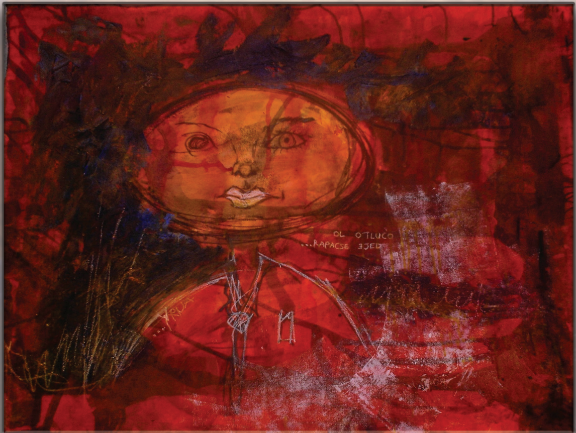
Yrua... oculto lo que deje rapacse , de la serie Faces ocultas (2006). Técnica mixta sobre papel: Elena Fabela. Prohibida su reproducción en obras derivadas.