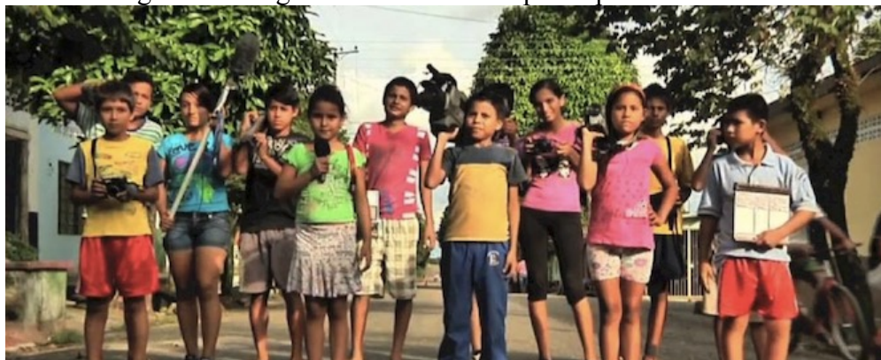
Figura 2: Fotografía de los niños/as participantes de la EAI