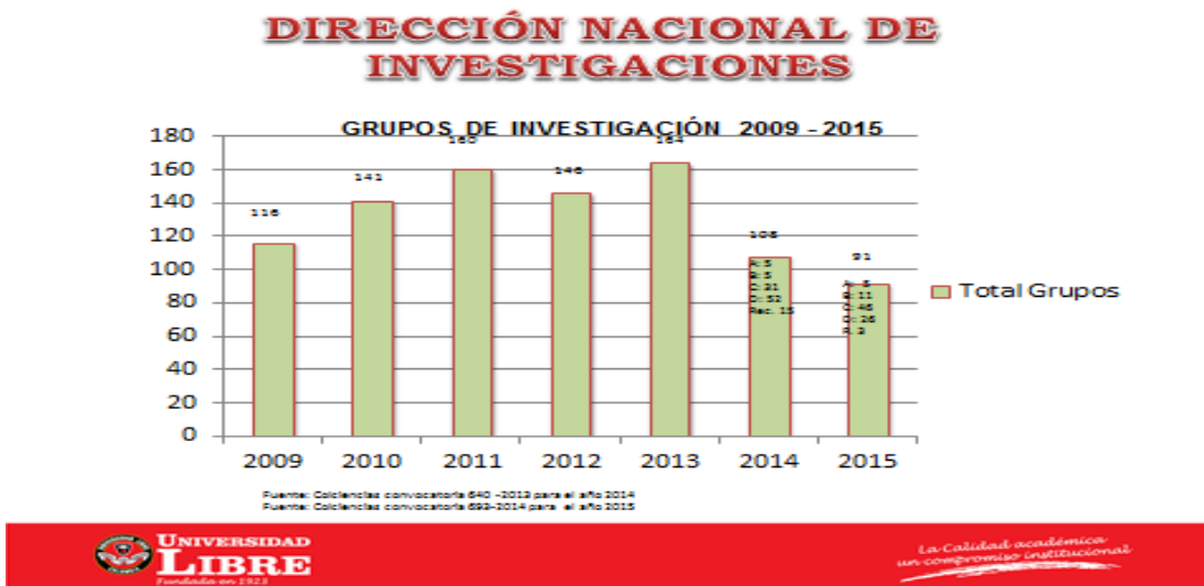
Gráfico 1 Evolución de los grupos de investigación a nivel nacional, de acuerdo con Colciencias