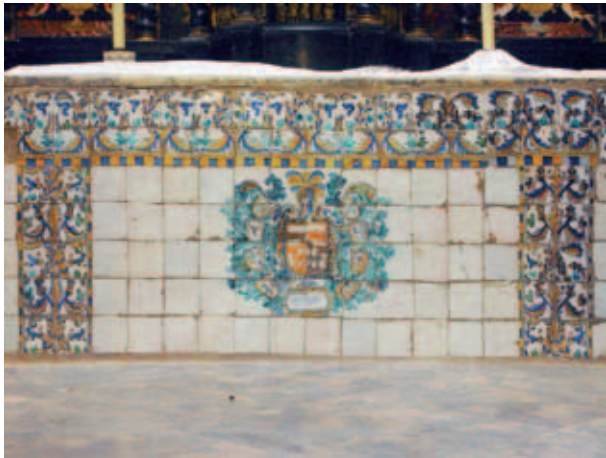
Altar con frontal de azulejos de la capilla de los Lastanosa de la catedral de Huesca.

En el caso que nos ocupa, el tercer escudo aparecido, fue rematado por la empresa personal que Vincencio Lastanosa compuso como lema propio: el ave fénix inmolándose en la hoguera para resurgir después de sus cenizas. Se trata de la segunda