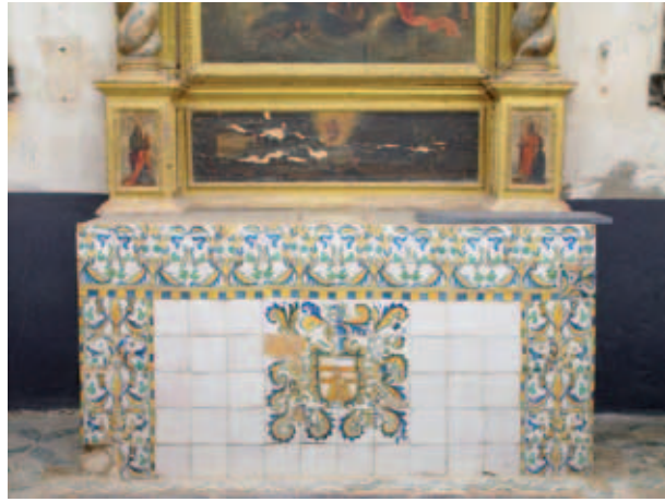
Altar con frontal de azulejos de la cripta de los Lastanosa de la catedral de Huesca.

empresa utilizada por el noble aragonés y aparece recogida en el libro Emblemas del conde de Guimerá y en la genealogía familiar escrita por el propio Lastanosa, 4 junto con la calavera coronada del laurel y los lemas epigráficos. Tal y como señala Fontana, “en esta otra imagen de la regeneración de la vida, el protagonista es una ave fénix, el ave fabulosa, supuestamente originaria de Arabia, que renace tras su autodestrucción y que, desde los primeros padres y escritores de la Iglesia, fue entendida como símbolo de la resurrección del hombre justo y virtuoso”. 5