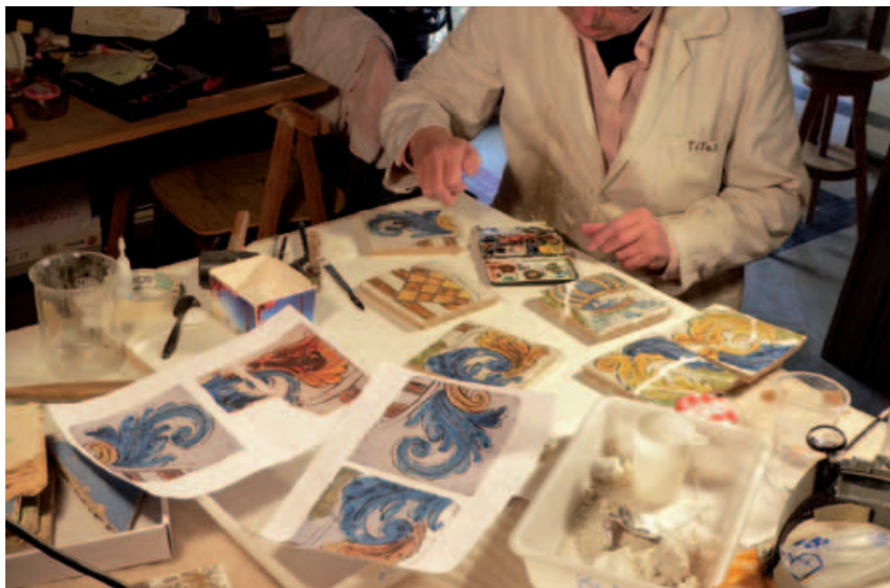
Proceso de conservación y restauración de la pieza en los talleres del Museo Diocesano de Huesca.

Como hemos señalado, el estado de conservación era irregular y las diferentes piezas de azulejería encontradas presentaban en algunos casos importantes fracturas limpias del soporte, así como pérdidas de volumen considerables. Estas fracturas afectaban sobre todo a la estabilización de la imagen, pero también favorecieron la expulsión de las sales desde el interior del bizcocho. Prácticamente todos los azulejos tenían en el reverso restos del mortero original de agarre que fueron sustraídos durante el proceso de extracción de cada pieza. Todos presentaban gran cantidad de suciedad, tierra adherida sobre la cara esmaltada y depósitos de abundante polvo.