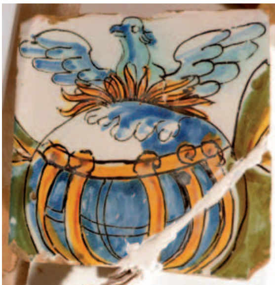
Azulejo con el ave fénix, emblema personal de Vincencio Juan de Lastanosa.