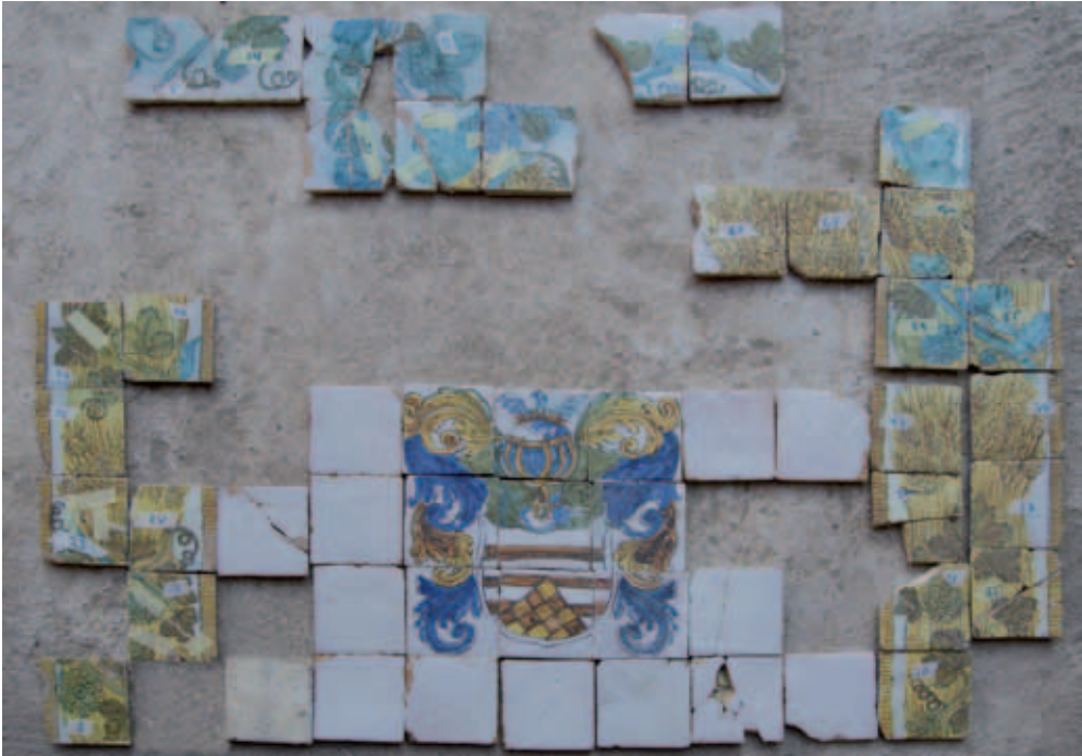
Aspecto del frontal de altar hallado, con el escudo de los Lastanosa en el centro de la composición.

o sufrir importantes deterioros durante el proceso de arranque, por lo que serían desechados. El conjunto tendría originalmente unas dimensiones de 108 centímetros de altura y 148,5 de anchura.