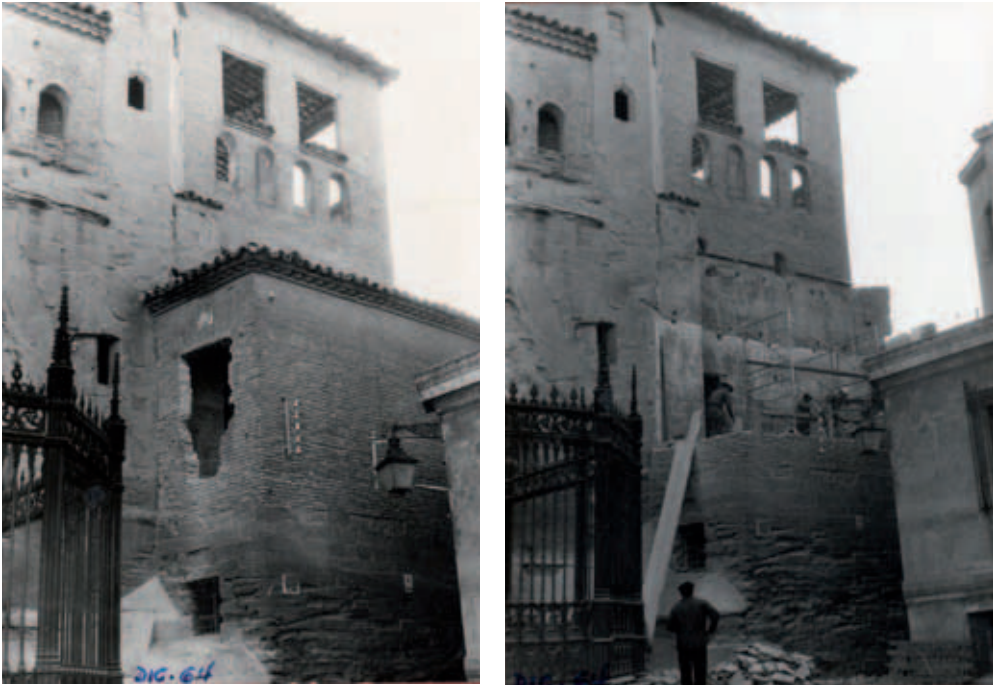
Imágenes tomadas durante el desmontaje y la demolición de la sacristía de la capilla de los Lastanosa, en el exterior de la catedral.

importantes motivaciones era el desagravio y el culto a la eucaristía y la celebración del misterio de la consagración, además de la exaltación de su propio linaje.