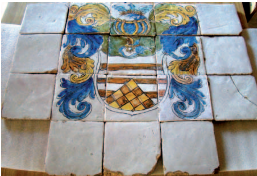
Aspecto de los azulejos que forman el motivo heráldico central del frontal.