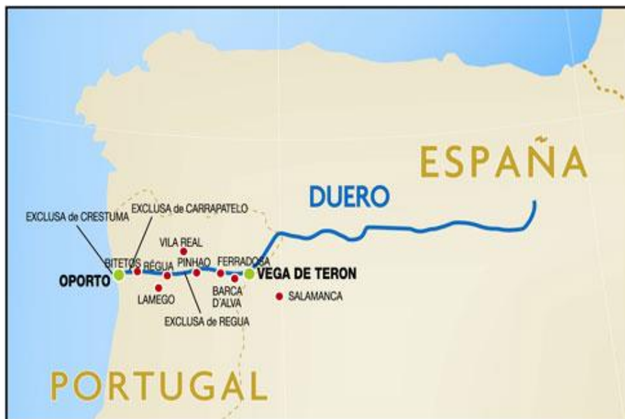
MAPA 2. El río Douro y las presas en el ámbito portugués

No entramos a valorar el interés del río Duero/Douro desde el punto de vista hidrográfico, pues nuestro estudio versa sobre la incidencia en el ámbito turístico, de unas actuaciones que han logrado en el último cuarto del siglo XX, la conformación de unos tranquilos lagos, que se suceden a lo largo del cauce, especialmente significamos las cinco grandes presas y cinco esclusas existentes en el tramo portugués, tal como se aprecia en el Mapa 2, las cuales se encuentran instaladas estratégicamente en uno de los extremos del río, permitiendo el desarrollo del turismo de cruceros fluvial.