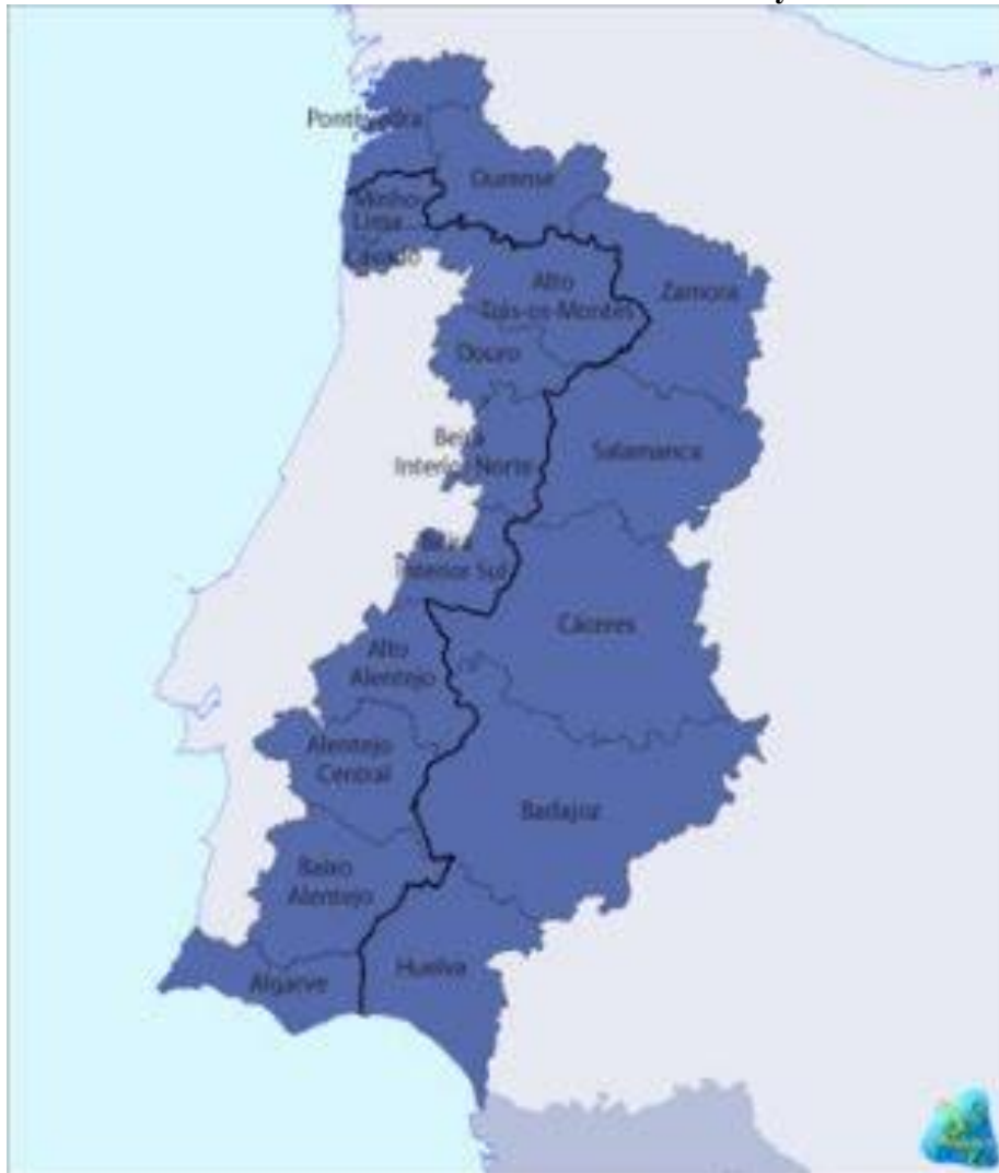
MAPA 1. Ámbito territorial de La Raya Ibérica