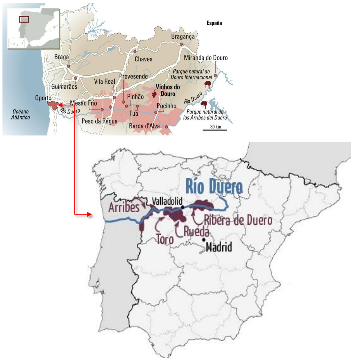
MAPA 3. El rio Duero/Douro y las denominaciones de origen

En general, la economía de la región gira en torno al Douro y los cruceros de corta duración, los de un día y los de duración semanal recorren Porto/Vila Nova de Gaia a Peso de Régua, Porto a Pinhao, Peso da Régua a Pinhao conformando una oferta turística donde las viñas y las quintas y los paseos temáticos hacen de proyección de la región en el resto del mundo (Amorin, et al, 2012: 1062-1063).