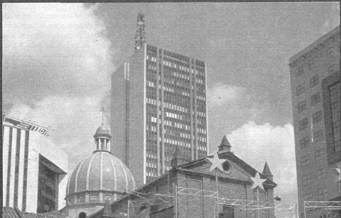
La plaza y la Iglesia Nueva de San Francisco rodeadas de incomprensibles edificios innecesariamente altos modernos y seudo posmodernos (Cali).