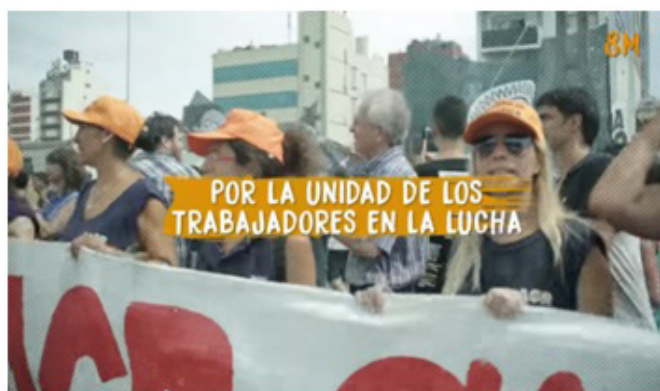
8M // Paro internacional de mujeres, Partido Obrero, 2017.

El despliegue gráfico y audiovisual de los partidos ubicados en el arco político de la izquierda se apoya en un formato expresivo aggiornado , a tono con el ethos de recambio generacional y de modernización internacional (afín al caso español de Podemos), en gran medida inspirado en una forma publicitaria que busca dirigirse a un público juvenil, interpelado por nuevas imago s, como Miriam Bregman, quien convoca al paro desde la apertura del video producido por la agrupación Pan y Rosas 9 , o como la participación de Raquel Vivanco en “Mujeres de la Matria Latinoamericana” (MuMAlÁ), el ala feminista del movimiento Libres del Sur, cuyo elemento distintivo son las pelucas fucsias metalizadas 10 . Su estilo de comunicar la militancia y su propia fotogenia (Barthes, 2005) contrasta con líderes de generaciones anteriores, como Vilma Ripoll (dirigente de Juntas y a la Izquierda y el Movimiento Social de los Trabajadores) y Nora Cortiñas (miembro de Madres de Plaza de Mayo Línea Fundadora), tal como se visualiza en el registro de la columna en la que marcharon el 8 de marzo de 2016 11 .