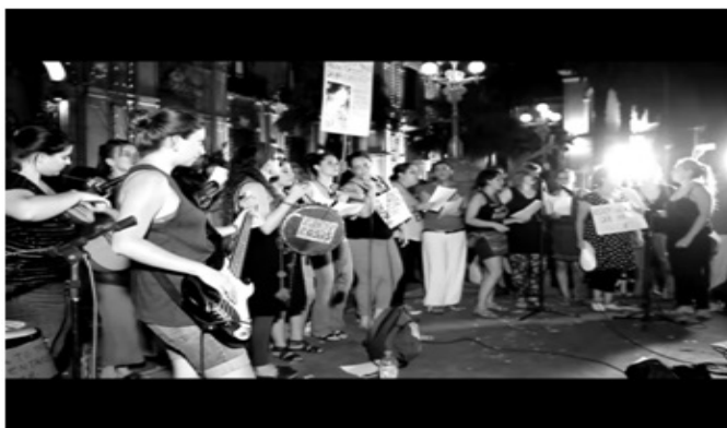
#8M: Colores, fuerza y lucha de una jornada histórica de mujeres, Agencia de Prensa Alternativa, 2017.

La Agencia de Prensa Alternativa 18 realizó un audiovisual que toma la forma de videoclip. Este consiste en una canción, grabada en vivo, que combina estilos de murga, de candombe y de reggae, cantada mayormente al unísono por mujeres en un registro de voz de contralto (se podría decir que a muchas de ellas la melodía “les queda demasiado grave”, como especialmente se nota en los pocos pasajes en los que se busca incorporar una segunda voz), con acompañamiento de charango, guitarra, bajo, percusión y algunos coros: “Hay en la noche un grito y se escucha lejano (...) es la voz del silencio. En este armario hay un gato encerrado porque una mujer defendió sus derechos”.