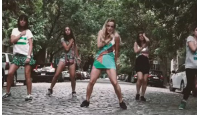
Grito fuerte, Combinado Argentino de Danza, 2017.