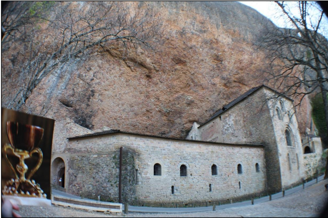
Fotografía: Ana Mafé García. Agosto 2017.

Ilustración 4: San Juan de la Peña, monasterio viejo en la provincia de Huesca.