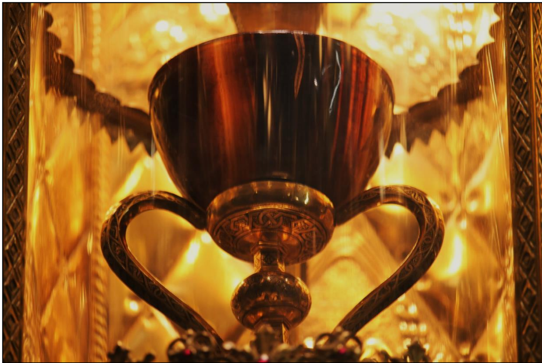
Fotografía: Ana Mafé García. Febrero 2017.

Ilustración 3: Detalle del vaso superior del Santo Cáliz de la Catedral de València.