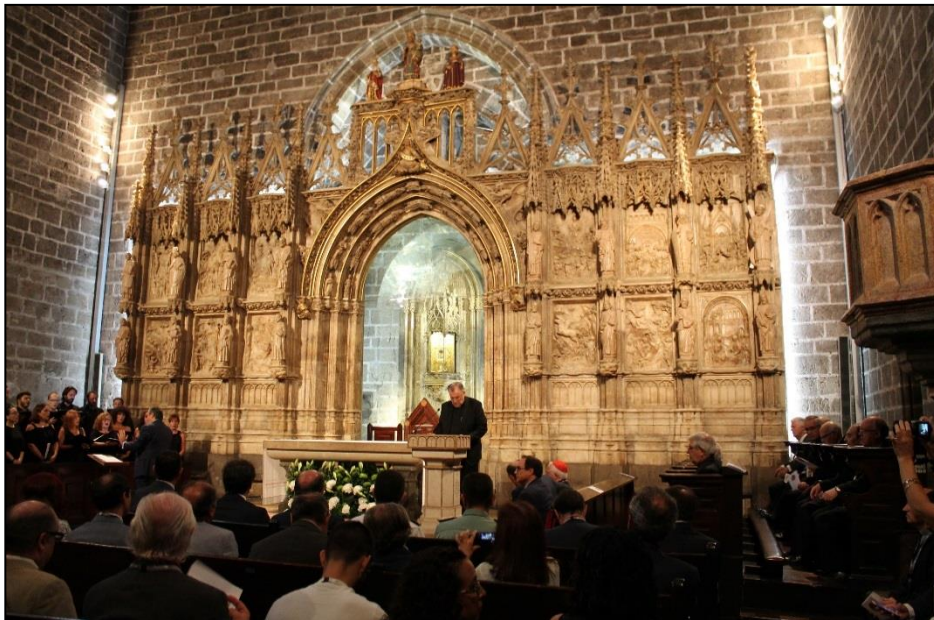
7 de septiembre 2017.

Por ello, consideramos tan necesarias estas vías de reflexión y estudio que lleven a contemplar encuentros que vertebren todas las posibilidades de gestión que ofrece nuestro patrimonio valenciano. Pues en las mismas surgen propuesta que ayudan a vehicular el patrimonio inmaterial, como por ejemplo hemos mostrado a través del relato turístico que compone la Ruta del Grial , la Ruta del Conocimiento o también llamado Camino del Santo Grial .