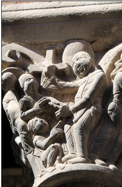
Fotografía: Ana Mafé García. Abril 2017.

Ilustración 1: Momento de entrega y bendición del Santo Cáliz. Capitel de San Sixto, Catedral de Jaca.