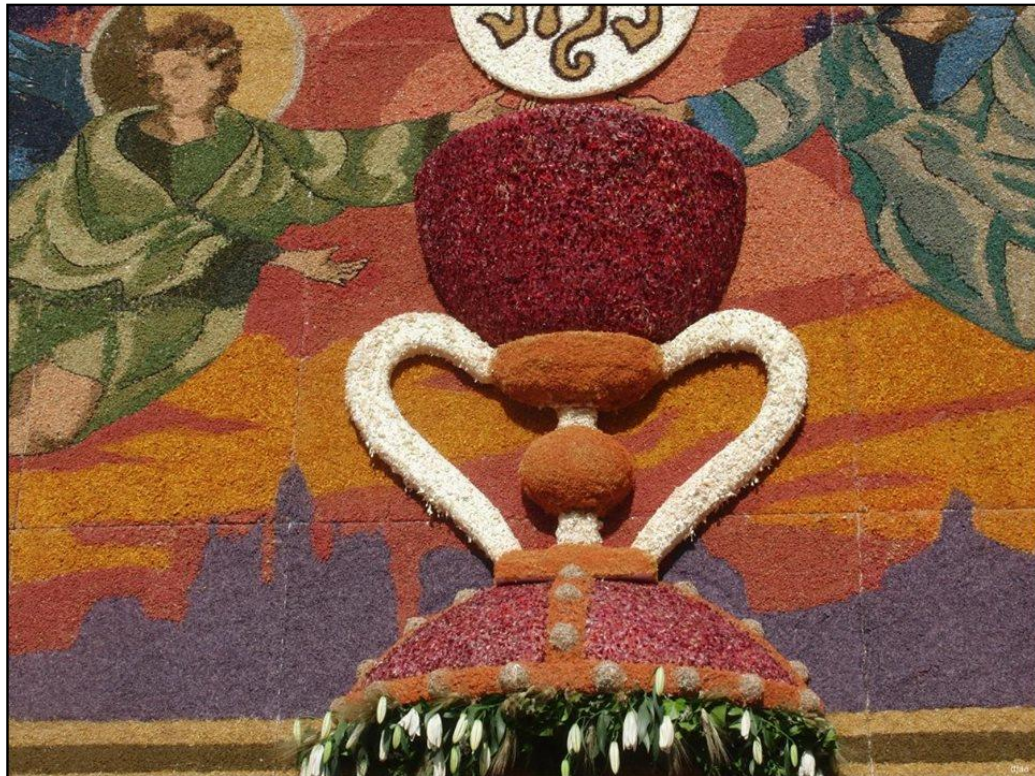
Ilustración 5: Tapiz del Copus Christi del Santo Cáliz, València.

Fotografía: Ana Mafé García. Junio 2016.