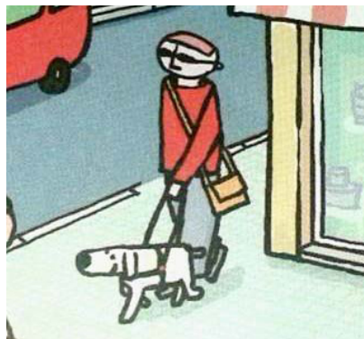
Figura VI Ejemplo de la diversidad funcional.