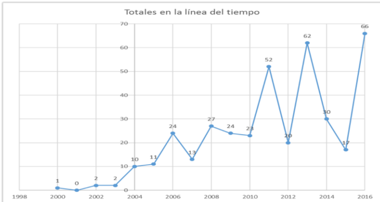
Grafico 3. Producción intelectual consolidada del grupo de investigación