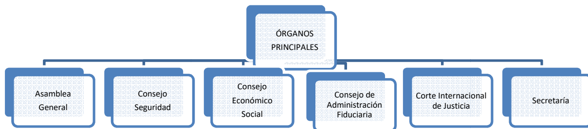
Imagen 2. Órganos principales ONU

En la actualidad, ONU trabaja en las siguientes temáticas globales: Mantener la paz y la seguridad internacional, Promover el desarrollo sostenible, Proteger los derechos humanos, Defender el Derecho Internacional y Distribuir la ayuda humanitaria. Para la consecución de sus objetivos, cuenta con seis Órganos Principales. Y, además de la propia organización, trabaja con otras organizaciones afiliadas que disponen de su propio presupuesto, liderazgo y membresía.