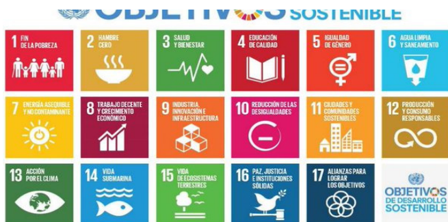
Imagen 4. ODS