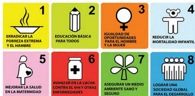
Imagen 3. ODM

De los ocho objetivos citados serán el objetivo 1, 3 y 7 los que están estrechamente vinculados con la temática de esta investigación.