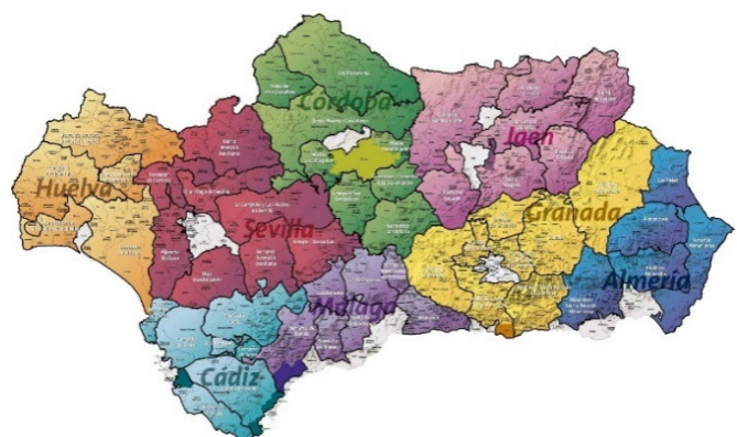
Imagen 11. GDR. Andalucía

En el periodo 2009- 2015 se desarrolló el Plan de Género en las zonas rurales con el objetivo de “Mejorar el nivel y calidad de vida de los habitantes en las zonas rurales, favoreciendo la incorporación a la vida económica y social del medio rural de determinados grupos de población escasamente representados, las mujeres y la población joven, para