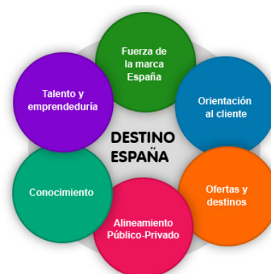
Imagen 10. Líneas PNIT