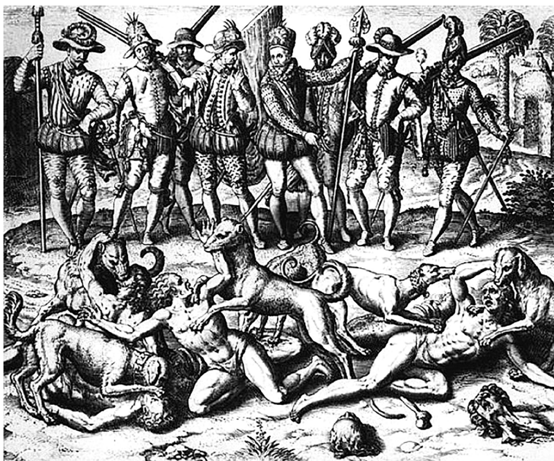
Grabado D: Théodor de Bry, América, Valboa throws some Indians, who had committed the terrible sin of sodomy, to the dogs to be torn apart. 1594.