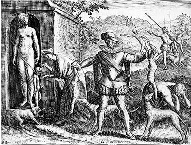
Grabado A: Théodor de Bry, América (Yucatán). Disponible en: http://www.cervantesvirtual.com/portales/bartolome_de_las_casas/imagenes_grabados/imagen/imagenes_grabados_14_bartolome_de_las_casas_theodore_bry_grabado (última consulta: 1/03/16).

La caracterización que se hace de estos nuevos perros coincide con el perro que hemos denominado monstruoso, de gran tamaño y fortaleza, amenazante, violento. La doble mención de las lenguas colgantes se vincula al jaeo, equiparable simbólicamente a los ruidos, rugidos, silbidos o cualquier otro sonido no humano que reemplaza el lenguaje verbal en el ser teratológico, todo lo cual tiene por función acentuar su irracionalidad. Además, los ojos de fuego poseen una impronta monstruosa por la asociación de este elemento con la esfera demoníaca, y la comparación con el tigre refuerza la fiera condición de estos perros que, lejos de ser mansos, se hallan en la misma línea que los animales salvajes.