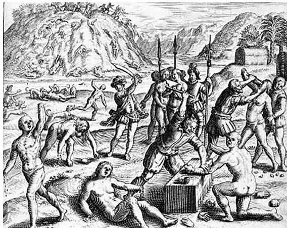
Grabado C: Théodor de Bry, América (Nueva Granada). Disponible en: http://www.cervantesvirtual.com/portales/bartolome_de_las_casas/imagenes_grabados/imagen/imagenes_grabados_17_bartolome_de_las_casas_theodore_bry_grabado (última consulta: 1/03/16).