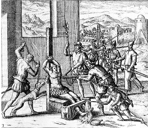
Grabado B: Théodor de Bry, América (Muerte del Cazonci, Michoacán).