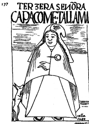
Tercera señora Capaz Oco: Talizna / Colisopo.

En suma, el arquetipo de perro americano presenta connotaciones positivas ligadas al vínculo cotidiano con el universo humano; no obstante, cuestiones como la violencia física y el mutismo que les es propio nos permite afirmar que los autores señalados los utilizan como herramienta de proyección simbólica del hombre americano.