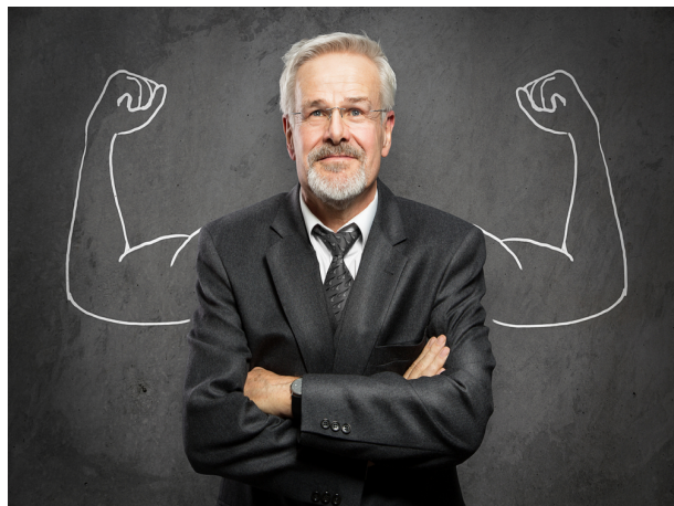
Figura 7. Empoderamiento personal

Debes comprometerte contigo mismo. Tener claro que la Fe y el temor son la misma fuerza pero en sentido inverso. “La Fe es la convicción de lo que no se ve y la certeza de lo que se espera.”