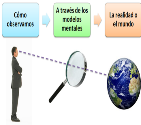
Figura 3. Paradigma expresado gráficamente Fuente: Elaboración propia.

Lo recomendable es dejar atrás todos esos modelos mentales que nos impiden avanzar.