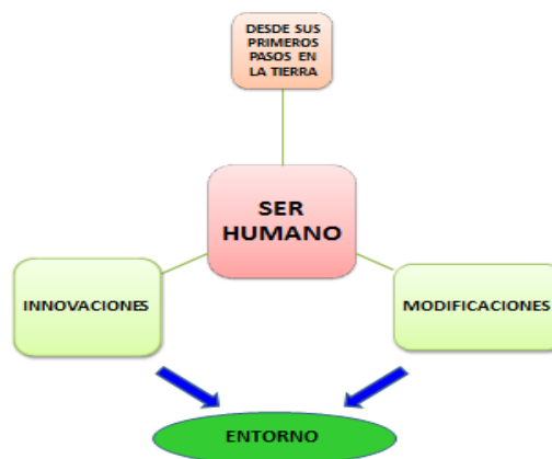
Figura 1. El ser humano como agente de cambio permanente

Desde su origen el ser humano es el responsable de los cambios que a través de la historia se perciben, pero todo ese esfuerzo de cambio siempre ha estado ligado a buscar una mejor condición y calidad de vida. Este largo e incontenible proceso de modificación del entorno es el resultante del continuo desarrollo que va logrando el ser humano. Esta capacidad transformadora les ha dado un rol muy significativo a ciertas personas que de manera individual o colectiva, han sido artífices fundamentales para la evolución de la sociedad.