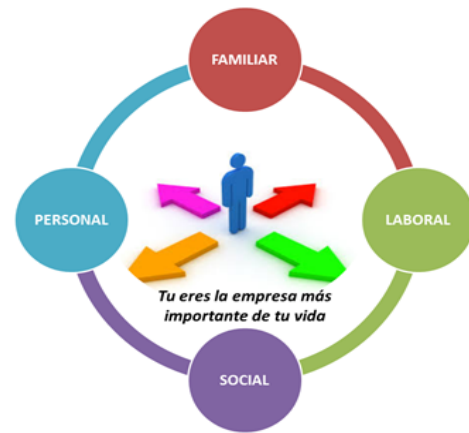
Figura 4. Aspectos que exigen fijar objetivos claros en nuestra vida

Cuando se habla de Innovación, no necesariamente se hace referencia a la tecnología. Innovar es renovar, introducir una novedad. En consecuencia, la innovación se genera a partir de la existencia de productos, procesos o situaciones. Duarte (2009). La creatividad es la aptitud o capacidad de percibir nuevas facetas de un problema, también permite ubicar una relación entre el tiempo y el espacio de un objeto, emplea a la innovación como la parte más activa de la creatividad. Galindo (2011)