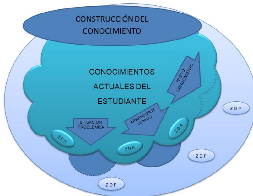
Figura 2. Interpretación del aprendizaje de Vygotski

El autor constructivista Lev Vygotski propone que el estudiante alcanza sus aprendizajes de la siguiente manera: Con sus actuales saberes se encuentra en la Zona de Desarrollo Actual (ZDA), en su búsqueda por aprender encuentra las dificultades y las sorteas para avanzar a la denominada Zona de Desarrollo Próximo (ZDP), por sí solo no llega a desarrollar todo su potencial de aprendizaje, pero el estudiante adquiere una función activa, donde se parte de su conocimiento cotidiano para ir relacionando con el conocimiento sistemático por medio del diálogo, en el intercambio de opiniones con el respaldo de un docente o un compañero más avanzado, se pueden alcanzar progresivamente mayores aprendizajes dentro de esta zona (ZDP). (Segura, 2005).