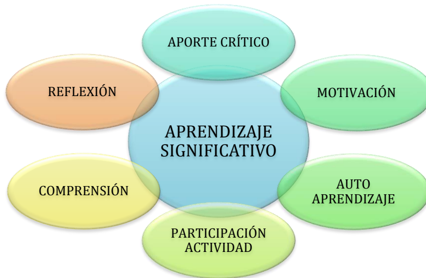
Figura 4. Ventajas del aprendizaje significativo