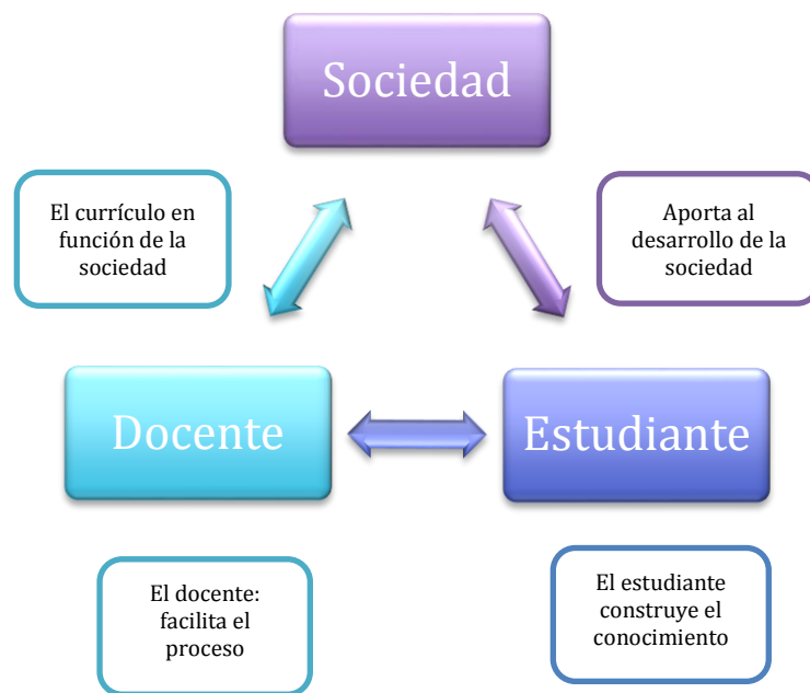
Figura 3. Constructivismo: Relación docente-estudiante-sociedad

El estudiante forma parte activa de la sociedad, de la que se nutre de sus saberes y avances, también debe formarse como un ciudadano que contribuye al desarrollo de la misma, que es capaz de hacer crítica constructiva, reflexionar y proponer soluciones a problemas del entorno.