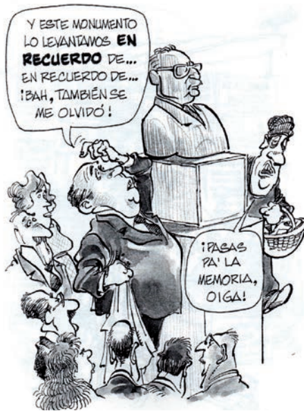
Figura 5. Puro Chile , 1998

El hito da pie a una caricaturización del momento y el monumento. En efecto, criticando la mala memoria nacional, la ceremonia de inauguración motiva un chiste gráfico dibujado por Eduardo de la Barra en el libro Puro Chile. Sátira Humorística y (anti)patriota (figura 5). Era de esperar que, con el paso del tiempo y el consiguiente desapego afectivo-personal de la persona Salvador Allende, su figura —como la de los padres de la Patria y otros próceres— es indefectiblemente alcanzada por la sátira desacralizadora que siempre se resistirá a aceptar lo canónico sin irreverencia.