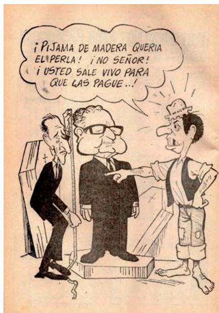
Figura 2. SEPA N° 93, noviembre de 1972

Allende: entre varias viñetas que muestran los diversos usos de la banda presidencial, una de ellas representa al Presidente colgando, ahorcado, con su propia banda presidencial. En el chiste, la imagen representa el uso “para casos de emergencia”.