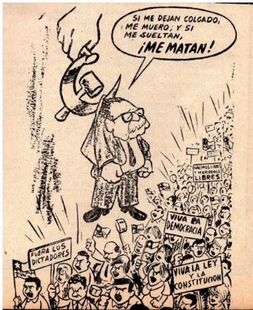
Figura 1. SEPA N°67, abril de 1972

“La trágica comparación de Allende ¿será capaz de imitar a Balmaceda?” ( SEPA , 7 al 13 de marzo 1972). Así, con mensajes verbales e icónicos se reforzó la orientación de un guión de vida que podía concluir en la muerte trágica. En el mismo ejemplar de la revista se publica una caricatura en la que Allende cuelga sostenido por la hoz comunista y abajo hay una muchedumbre esperando que caiga para lincharlo. Al dibujo se le atribuye una disyuntiva fatal: “Si me dejan colgado, me muero; y si me sueltan, ¡me matan!” (ver figura 1). En otra caricatura, “el otro Yo del Doctor Allendengue” 5 , el personaje se muestra temeroso de la masa popular y, antes de asomarse al balcón, en su fuero interno (el otro Yo) piensa que debe usar chaleco antibalas. Pero Allende no era el personaje dibujado. Ya había dicho, al enfrentar a unos contramanifestantes durante una de sus campañas: “¡Si yo me tengo que cuidar del pueblo no merezco ser presidente de Chile!” (Citado en Puccio 73).