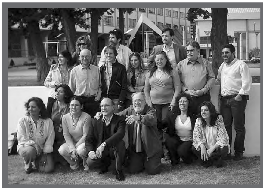
Expositores de Venezuela, Uruguay, Chile, Perú, Argentina, El Salvador y Ecuador

En estos tiempos que corren donde la desesperanza y el fatalismo se imponen subjetivamente, cerrándonos caminos, quizás haya que recobrar la utopía y resignificarla para continuar adelante.