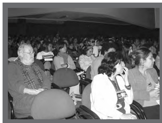
Distintos momentos del desarrollo de las actividades tanto culturales como académicas del Congreso.