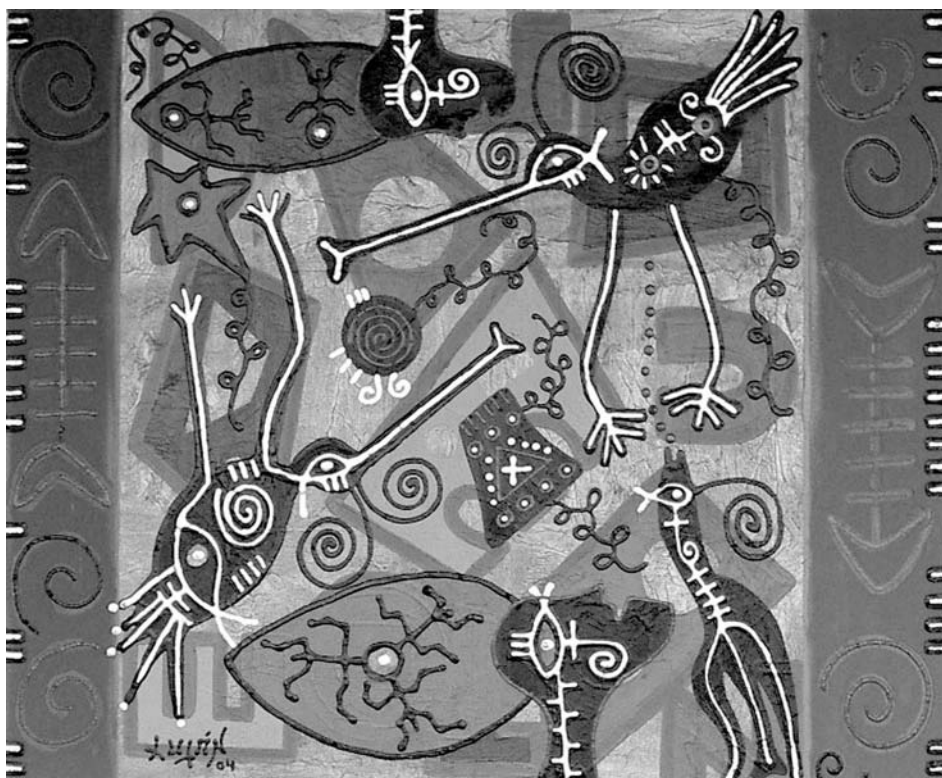
Imaginería. Técnica mixta sobre lienzo