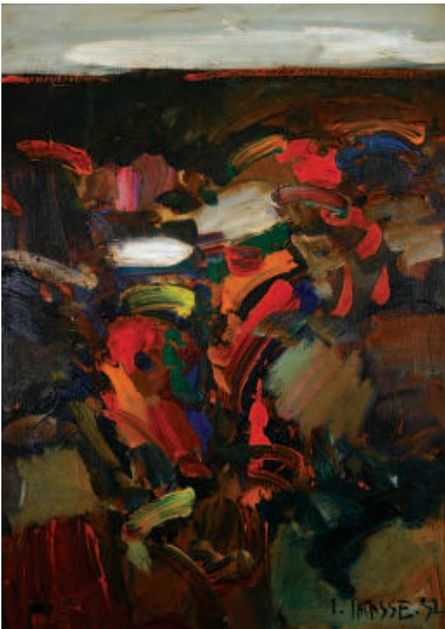
Alegoría. Óleo sobre lienzo. 1992

M. Así ellos han sacado préstamos para ganado, para potreros, como con la fumigación se les murió el pasto, entonces quedaron endeudados, tuvieron que vender el ganado, el ganado se les enfermó, se les murió. -¿Y con qué Banco? -Con el Banco de Fomento.