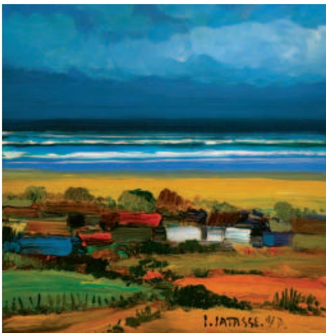
Serie Marina. Acrílico sobre lienzo. 2007

la colonización de los bosques tropicales de la Costa y del Oriente amazónico sirvió con eficacia para desactivar buena parte de la movilización social que en aquel entonces se centraba alrededor del sistema latifundista del altiplano andino (...) la iniciativa del Instituto de Reforma Agraria y Colonización (IERAC) redundó en una ampliación de la superficie agropecuaria nacional del orden de cuatro millones de hectáreas entre 1964 y 1984 una ampliación sin precedentes que atenuó las presiones sobre la hacienda_ (Bretón 1999: 284).