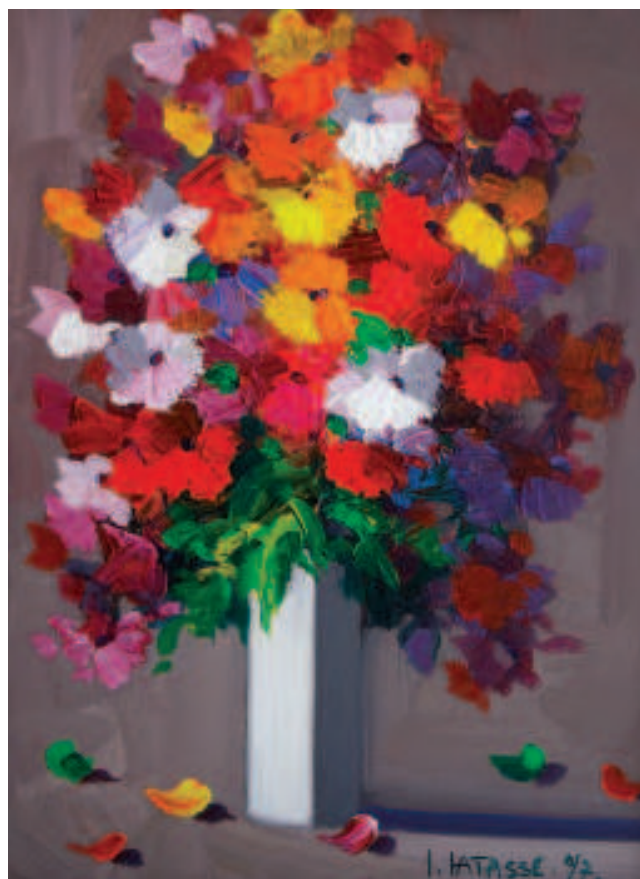
Florero. Acrílico sobre lienzo. 2007

una comunidad, se hace cada vez más virtual en algunas regiones del planeta. En nuestros países, de la llamada según Wallerstein, periferia dentro del sistema mundo capitalista, se conserva un arraigo a las identidades locales y territoriales. Como ocurre en las comunidades de la frontera norte. Esto nos lleva a considerar el sentido de pertenencia, ser y sentirse reconocido como parte de uno o muchos grupos humanos, es un primer eslabón a considerar en todo proceso comunitario. Por esta razón es necesario incorporar una definición 'ideal', a decir de Krause, que posea elementos que distingan una comunidad de otro tipo de conglomerado. Tal concepto de comunidad estaría basado en la inclusión de tres