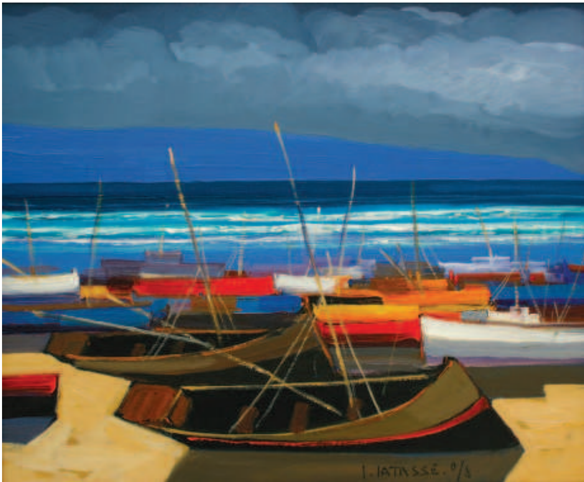
Serie Marina. Acrílico sobre lienzo. 2008