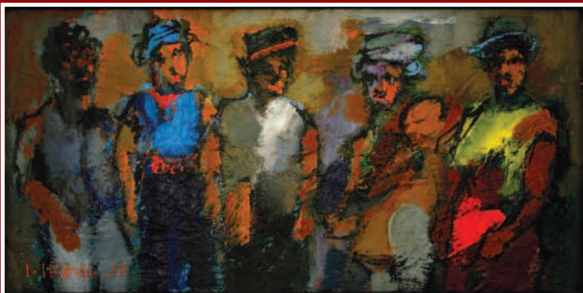
Los compadres. Acrílico sobre cartón. 1996

La prolongación indefinida de la guerra supone la normalización de este tipo de relaciones sociales deshumanizantes cuyo impacto en las personas va desde el desgarramiento somático hasta la estructuración mental, pasando por el debilitamiento de la personalidad que no encuentra la posibilidad de afirmar con autenticidad de su propia identidad. No se pueden enten-