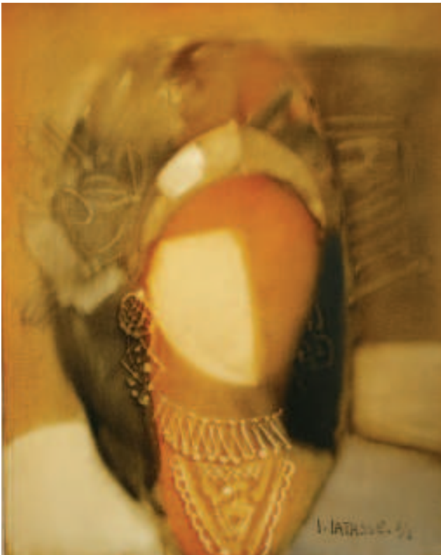
Elizabeth. Difuminado. Óleo sobre lienzo. 2008

los cultivos ilícitos, la lucha contra la insurgencia hoy llamada 'narco terrorismo' con la