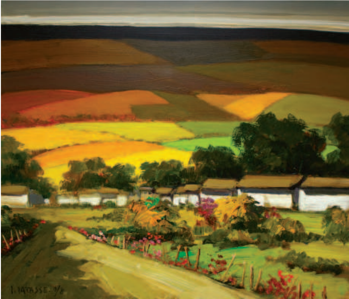
Huambaló. Acrílico sobre lienzo. 2008

bién exterioridad, empiricidad, facticidad; es una totalidad que se instala en un espacio (para transformarlo en territorio) y en un tiempo (para transformarlo en discurso histórico: pasado, presente, futuro); la Formación Contextual es disposición ordenadora de objetos y de personas; es escenario que propone marcos interaccionales (fija itinerarios, recorridos y moldes de encuentro psicosocial); es marco conversacional (propone temas de conversación, establece reglas para lo decible); es entramado afectivo y emocional (establece estados de ánimos basales, transcurros afectivos, flujos