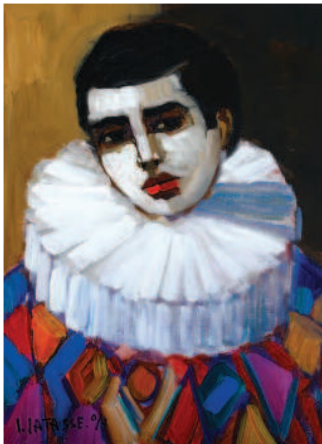
Arlequín. Óleo sobre lienzo. 2007

En el año 2001 el gobierno de George Bush perteneciente al grupo 'Los Halcones', ala ultra conservadora del partido Republicano, ex-