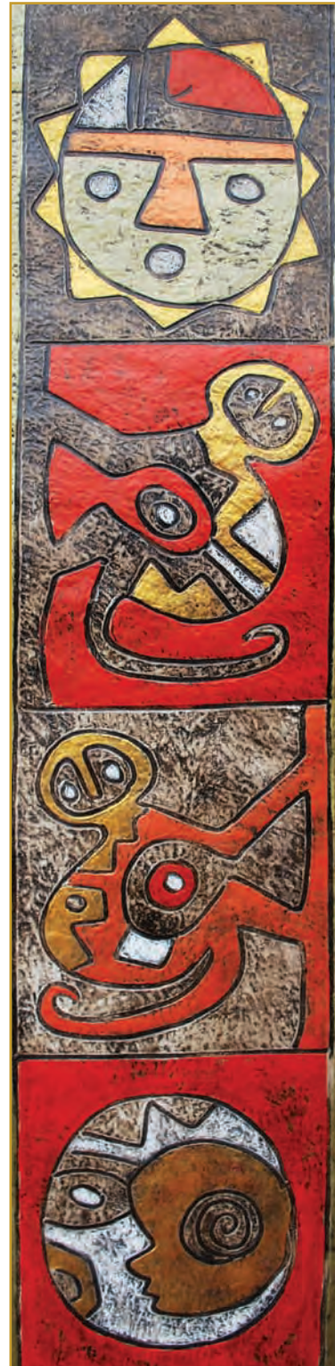
Kusi (Mono) Mixta 2010