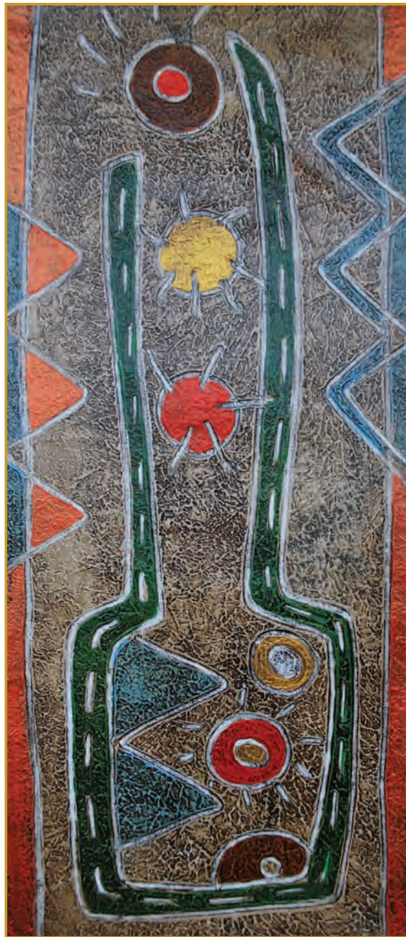
Tukuy (Todo...) Mixta 2010

La conducción de la Iglesia católica no puede centralizar todas las decisiones y declaraciones de sus obispos de diócesis hermanas. El Papa, el obispo de Roma, es el 'primero entre los hermanos' pero no puede pretender acaparar al Espíritu del Señor que sopla donde quiere y como quiere. Jesús le dijo a Pedro: "Pero, cuando llegues a viejo, abrirás los brazos y otro te amarrará la cintura y te llevará donde no quieras". Jesús lo dijo para que Pedro comprendiera en qué forma iba a morir y dar gloria a Dios (Jn 21, 18–19). Esa es la actitud cristiana que da la vida, actúa con libertad. Pedro acepta al final de su vida el martirio y no cae en componendas incorrectas con quienes tienen privilegios. Es capaz