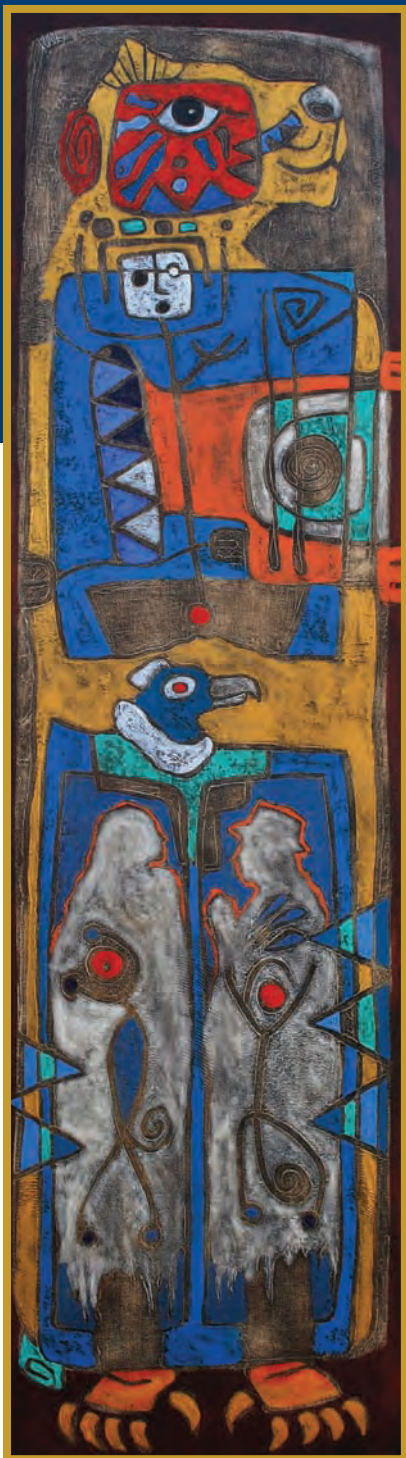
Tawa - suyo (Cuatrto espacios) Mixta 2010