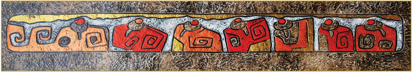
Kuyuri (Movimiento) Mixta 2010