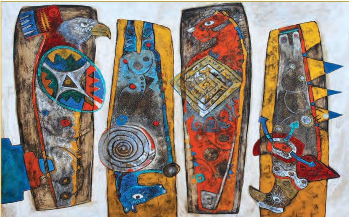
Kawsay manta (Por la vida) Mixta 2010

Reino de Dios, como parte viva de la Iglesia. Las palabras no bastan. Se necesitan hechos, vida, desprendimiento, pobreza, sencillez, libertad de corazón, a lo que lleva el mensaje de las bienaventuranzas. Una institución que da orientaciones sobre lo bueno y lo malo en la sociedad se parece más al Sanedrín judío o a una sinagoga, pero no a la comunidad cristiana, pueblo de Dios que Jesús ha iniciado. Los ‘buenos consejos’ tienen poca incidencia social; los testimonios de vida de los que se juegan la vida por Cristo son los que entusiasman. En la medida en que la Iglesia imita a una gran ONG con su burocracia y sus directrices, sigue siendo ‘hija de este mundo’. Pero cuando hay cristianos y cristianas que se insertan en los diferentes espacios de la sociedad y de la Iglesia como fermento, entonces podemos tener esperanza de una renovación de la Iglesia católica.