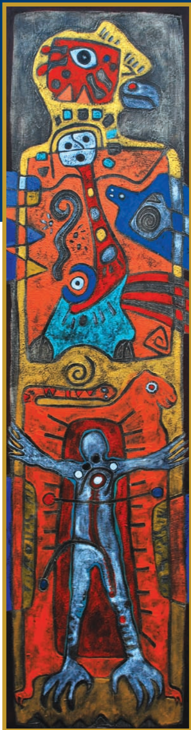
Tawa-suyo (Cuatro espacios de vida) Mixta 2010