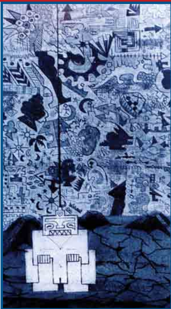
Fragmentos Grabado, 1994