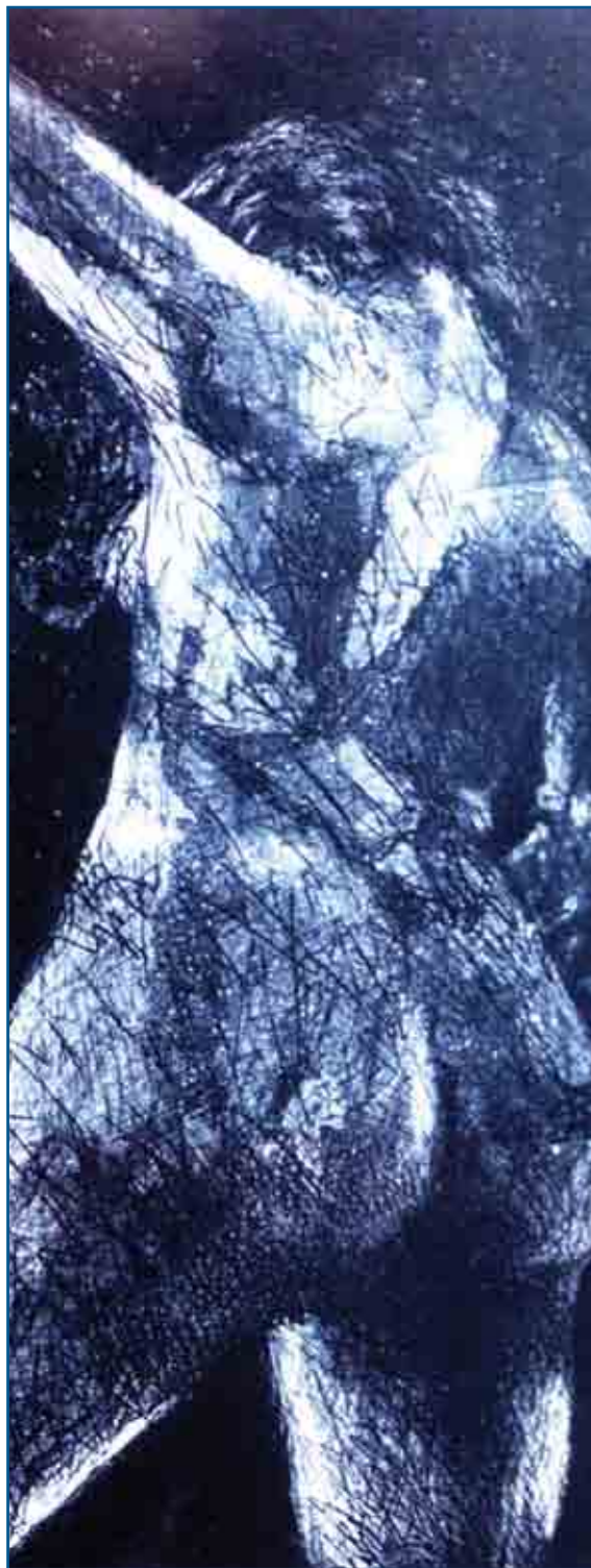
Mujerón Grabado, 1995

Es necesario empezar a considerar la dimensión política de la espiritualidad, así como también aportar una concepción espiritual de la política como parte de una concepción integral de la vida. Hablar de espiritualidad en la política puede parecer paradójico, dado su profunda deslegitimación y descrédito, pues hoy la política se concibe como simple lucha por el poder, y no como toda acción individual o colectiva que busca cambiar la vida; hoy se ve la política como una simple confabulación de estrategias e intrigas perversas que se sostienen en las enseñanzas maquiavélicas de que todo vale; que el fin justifica los medios, o divide y reinarás, que ha permitido acceder, mantener y acumular poder;