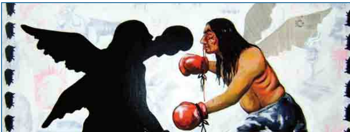
De la serie Fractales

La espiritualidad posibilita la superación de esa visión fragmentada y fragmentadora de la realidad heredada del racionalismo fundamentalista cartesiano occidental, cuyo discurso del método enseñó entre otras cosas, que para conocer la realidad y la vida y poder describirlas