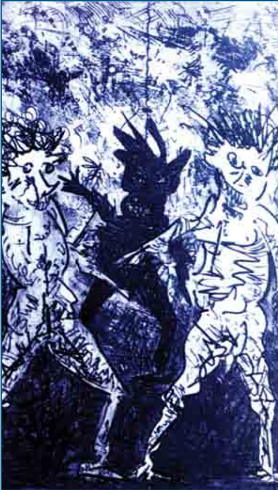
S/T Grabado, 1994

como dicen las sabidurías andinas, en la que el cosmos y la vida, son los centros vitales de la lucha y de la existencia.