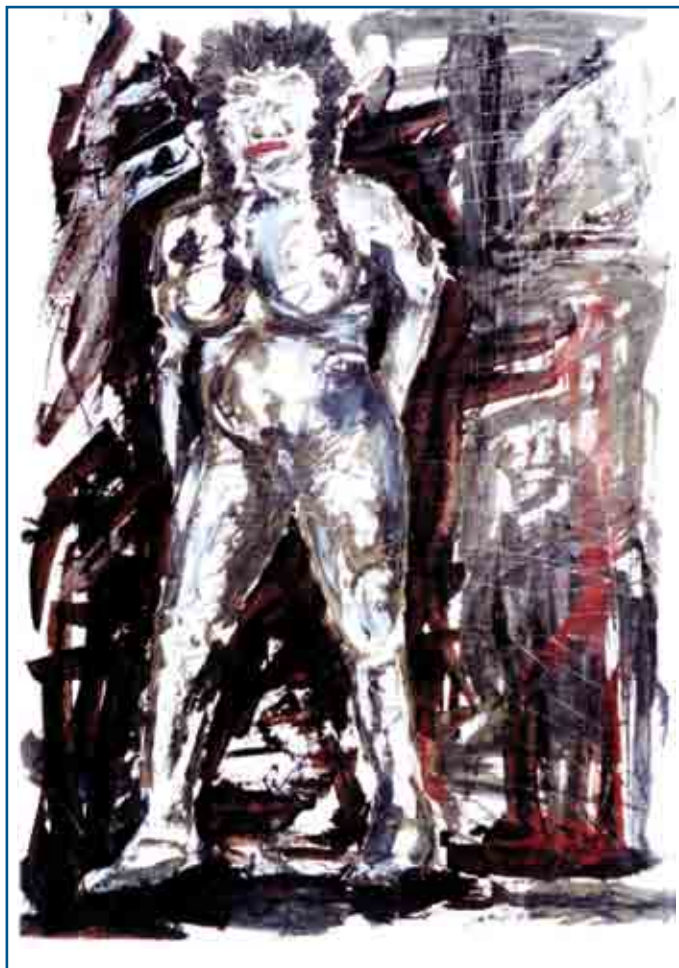
S/T Mixta sobre papel, 1996

yo creo que el haber sido muy intelectuales, muy racionales, nos hizo perder mucho de vista el objetivo de entrar en este camino espiritual en el noventa con el movimiento indígena, creer de que yo soy amo y señor de estas tierras y desde el resentimiento porque 500 años ha sido relegado, 500 años ha sido marginado, 500 años ha sido discriminado, y como ahora decir me toca a mí desde la revancha, y eso nos hace encegucernos, a eso responde que actuemos sin sentido espiritual y sin sabiduría, cuando la sabiduría es esto; la sabiduría sería ese saber espiritual de múltiples colores que vienen de muchas partes, pero que también no solo está en la cabeza, sino en el corazón.