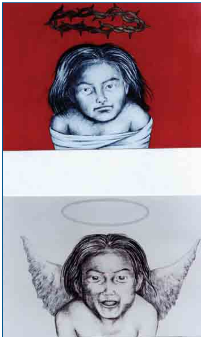
De la serie Ángeles caídos

Desmoned Tutu. Es uno de los hombres que más contribuyó para evitar que África del Sur tuviera que escoger entre un racismo inaceptable y una guerra civil sangrienta. Por esto en 1984 recibió el premio Nobel de la Paz. Obispo anglicano, es uno de los principales promotores de la ‘teología negra’. Escribió varias obras sobre esta temática y sobre la necesidad del perdón y la reconciliación. Según él, “los países ricos deben revisar los principios fundamentales del capitalismo, que tienden a exaltar algunos de los aspectos menos nobles del carácter humano”.