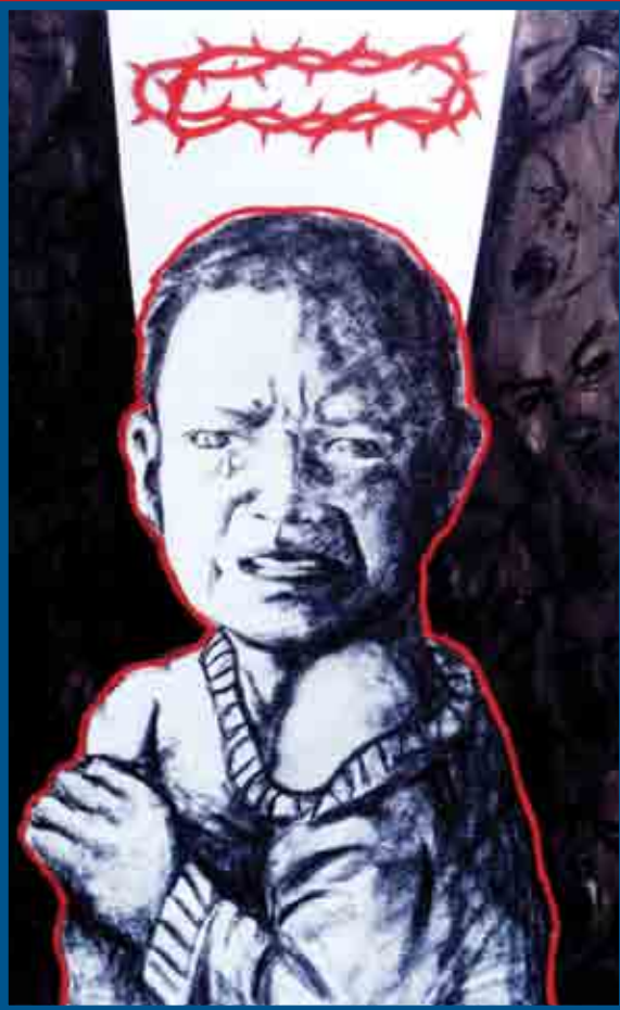
S/T Mixta sobre tela, 2002