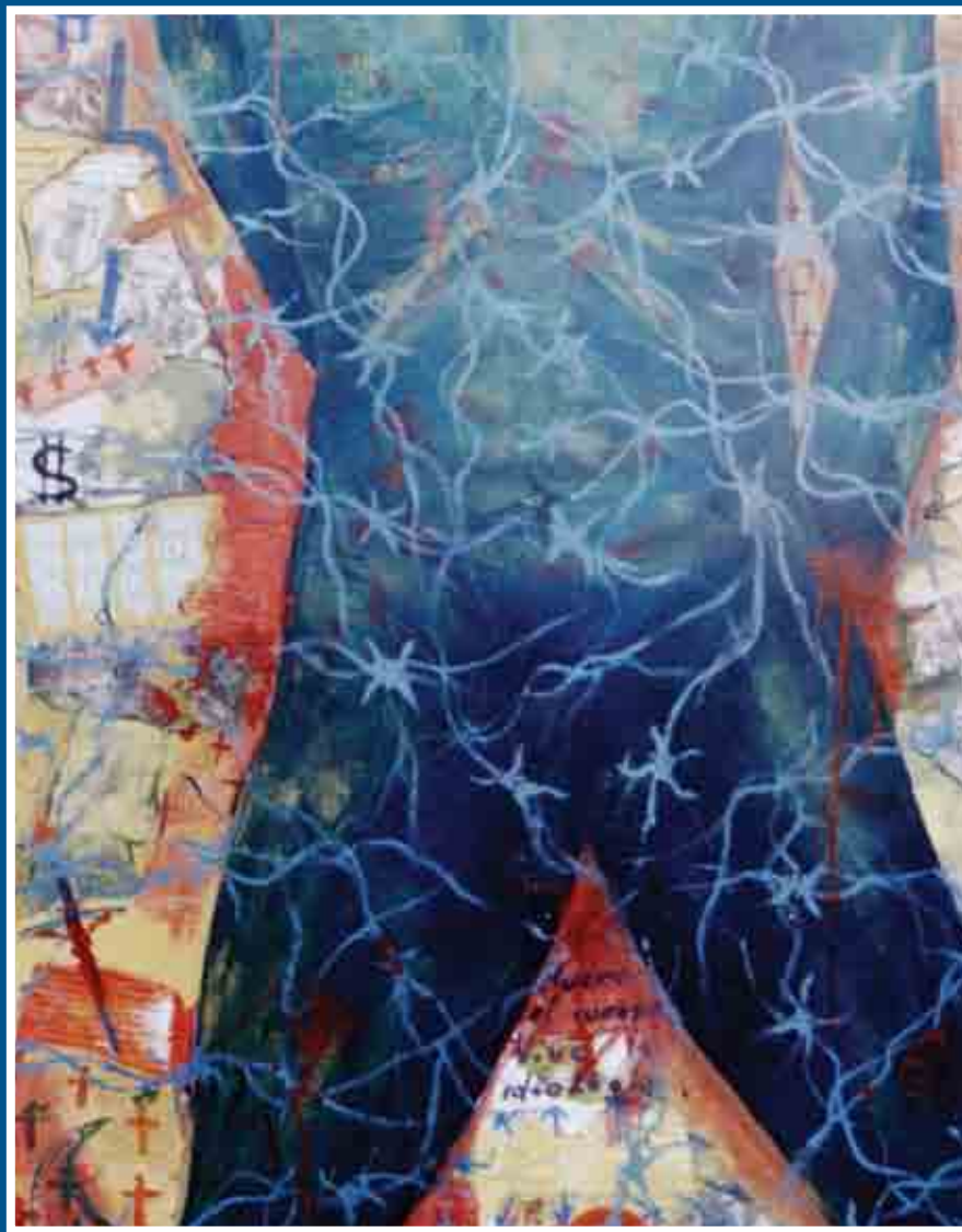
Resultado de la persecución a un dirigente 1995