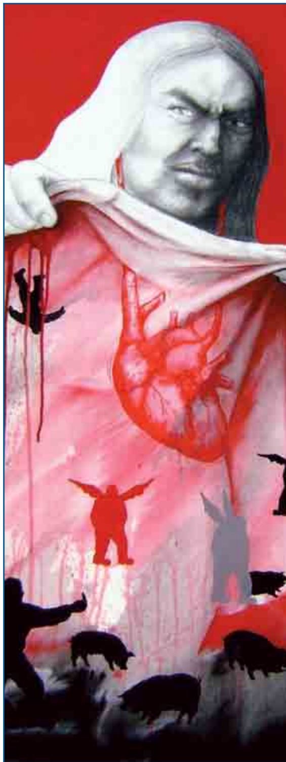
De la serie Fractales

Poco a poco se fue elaborando el concepto de cristiandad: el conjunto de los bautizados,