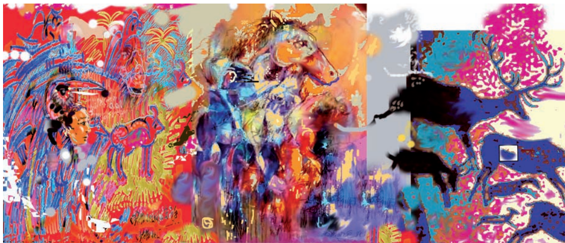
HACIA LOS ARUPOS Acuarela y arte digital (2013) 1,05 x 0,50m

res de diferentes colectivos por lograr el objetivo que se propone al inicio de este estudio. No cabe duda que el alcance de personalidades morales autónomas que alcancen el papel de «ciudadanía crítica» (Gozálvez, 2013) constituye una tarea compartida que implica a diferentes sectores de la sociedad, desde la familia, al grupo de amigos, la escuela y los propios medios. Con respecto a estos últimos, cabe señalar la vital importancia del desarrollo de una actitud responsable y comprometida por su parte. Más allá de los intereses de mercado se sitúan los valores propios de cualquier sociedad democrática que deben respetarse y fomentarse.