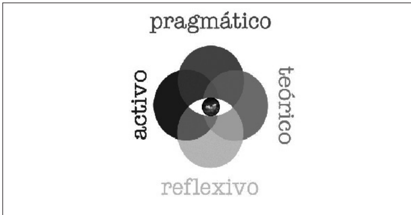
Figura 1. Estilos de aprendizaje según Alonso, Gallego