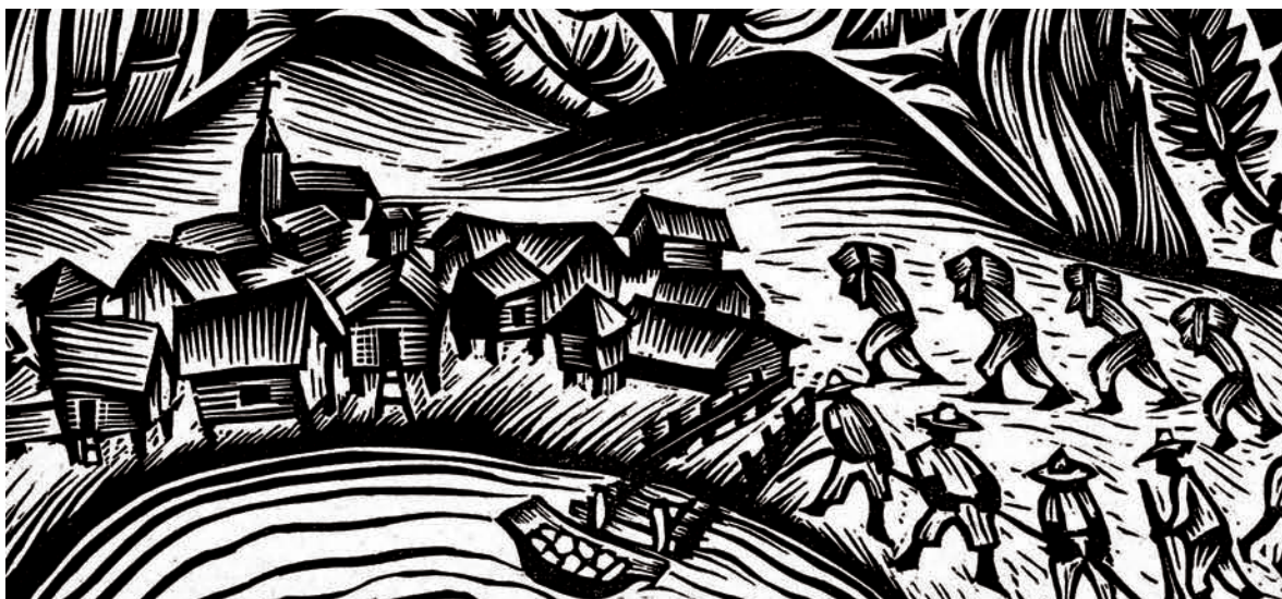
Pueblo tropical. Fragmento. 1946