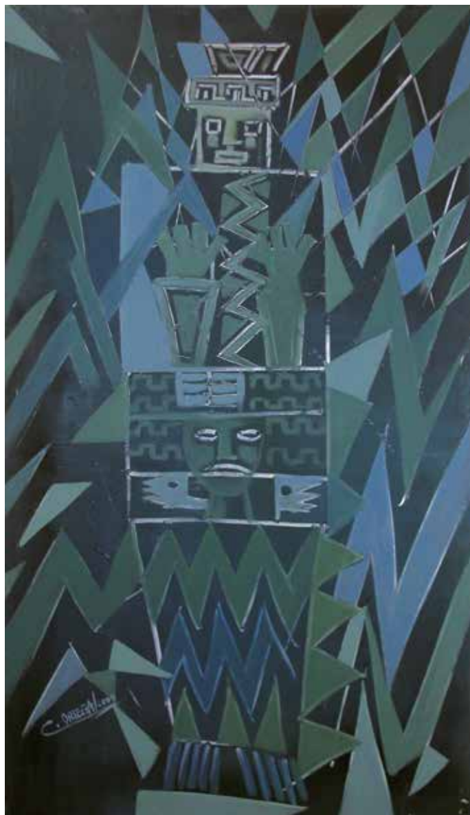
KONTIKI Acrílico sobre tela 84x120