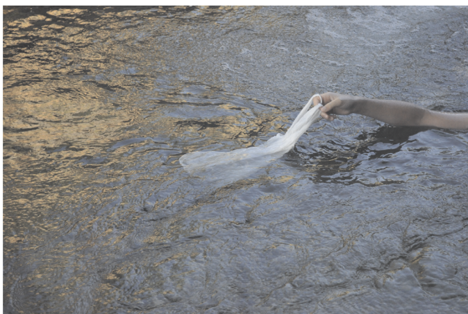
Una de las fotografías finales, acompañadas por el sonido de la fuerte corriente del río, de El arrendajo .

Salvando las distancias, algunos sonidos y fotografías proceden en el cortocuento como lo hace un link en un hipertexto, es decir remitiendo a otras informaciones, produciendo asociaciones y expandiendo el texto. Aunque el cortocuento no es familia directa del hipertexto, sí es, en la medida en que lo es todo buen cuento, una obra cuyas fronteras y límites son difusos. Y a su vez, aún con un único itinerario de lectura, ofrece al lector la posibilidad de proseguir con total libertad por los itinerarios que desee. De hecho, en el relato El arrendajo , las fotografías finales pretenden ser un posible itinerario por el que se podría continuar el relato, que, a su vez, no cierra ni concluye la historia.