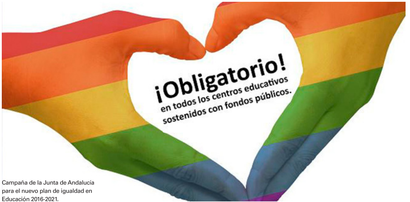
Campaña de la Junta de Andalucía para el nuevo plan de igualdad en Educación 2016-2021.

el efecto mediático de forzar una ley en minoría, sin embargo, otras comunidades como Valencia y Castilla La Mancha, dilatan los tiempos al anunciar que desarrollarán leyes en este sentido.