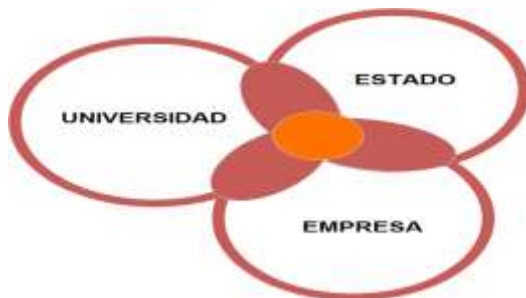
Figura 2 Modelo Triple Hélice

El modelo Triple Hélice que de acuerdo a Etzkowitz & Leydesdorff (2000) capta de manera relevante las interacciones entre universidad-industria-gobierno, de manera que la universidad contribuya al desarrollo económico y social a nivel nacional a través de organizaciones híbridas como centros tecnológicos, parques científicos e incubadoras, este modelo se presenta en la figura 2