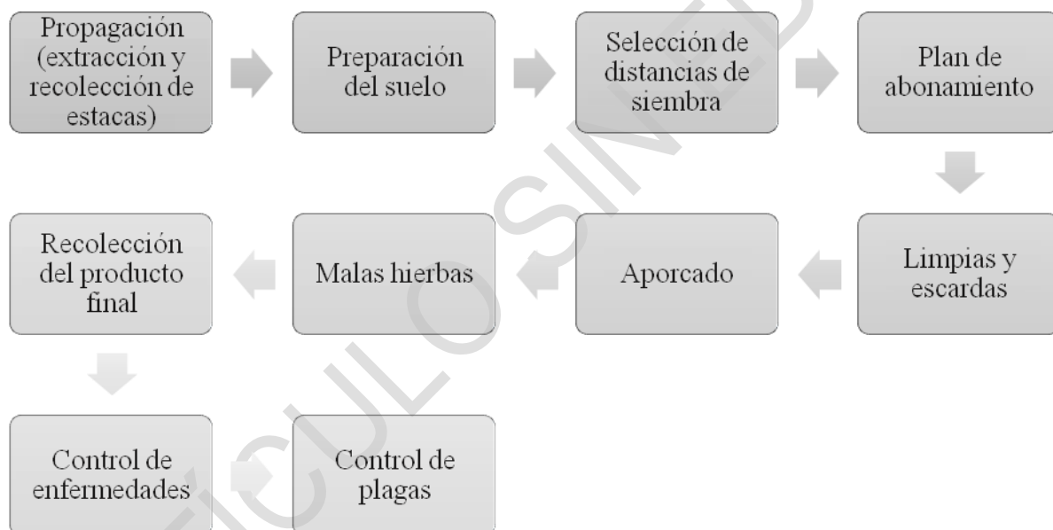
Figura 2. Proceso de producción de la yuca.

El cultivo de yuca pasa por diferentes etapas, como se muestra en el siguiente esquema: