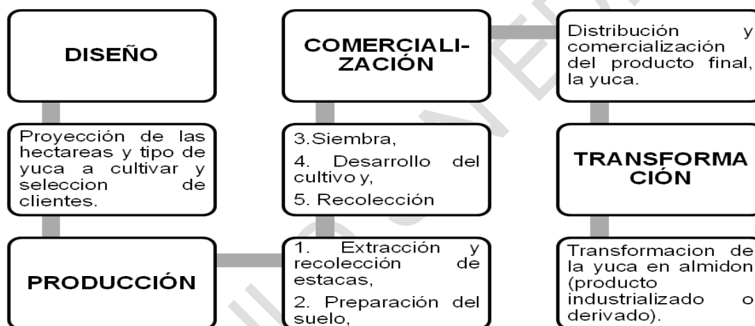
Figura 3. Cadena productiva de la yuca en Colombia.

Posterior a este proceso, se da la distribución y comercialización por hectáreas o toneladas al cliente final (familiares, vecinos o consumidores locales, empresas productoras de almidones, compradores y distribuidores nacionales, entre otros). En algunos casos continúa con la etapa de transformación del producto final en un producto industrializado, tal como en el caso de los almidones de yuca.