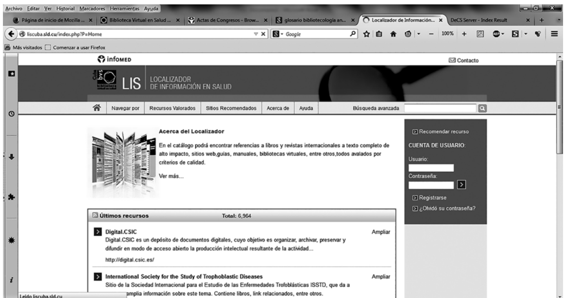
Figura 1. Página principal del DIS.

Contiene una barra de navegación que se encuentra en el cabecal del Sitio y esta dividido por diversas etiquetas, la primera es “Navegar por” que permite navegar por provincia y municipio, por tipo