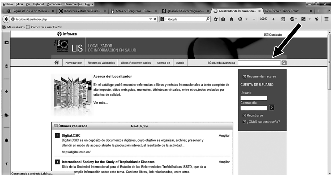
Figura 2. Búsqueda simple.

de institución y por nivel de subordinación, tiene otra etiqueta "Acerca de" incluye los objetivos, la estructura, los usuarios para los cuales fue diseñado, los beneficios y el respaldo legal del DIS, y como última sección es "Ayuda" que contiene preguntas más frecuentes para facilitar la búsqueda a los usuarios.