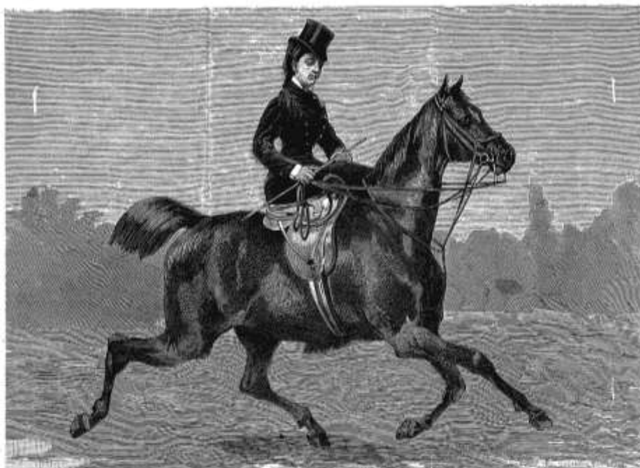
LA SEÑORA DUQUESA DE BUZOGÁN.

Además de ser la primera publicación que dedica una mención especial al sport , sin duda fueron sus grabados uno de sus elementos más llamativos. Desde su primer número utilizó la imagen como medio de difusión de un ideal social. Las litografías que publicaban reflejaban un mundo idílico en el que la actividad al aire libre se transmitía como un acto de nobleza y tradición. El espacio rural era reconstruido como si del paraíso se tratase con grabados de animales mansos, bellos parajes e ilustres castillos. Uno de cada dos ejemplares presentaba una litografía protagonizada por paisajes que ilustraban fincas, palacios o castillos propiedades de la aristocracia española y en ocasiones extranjera.