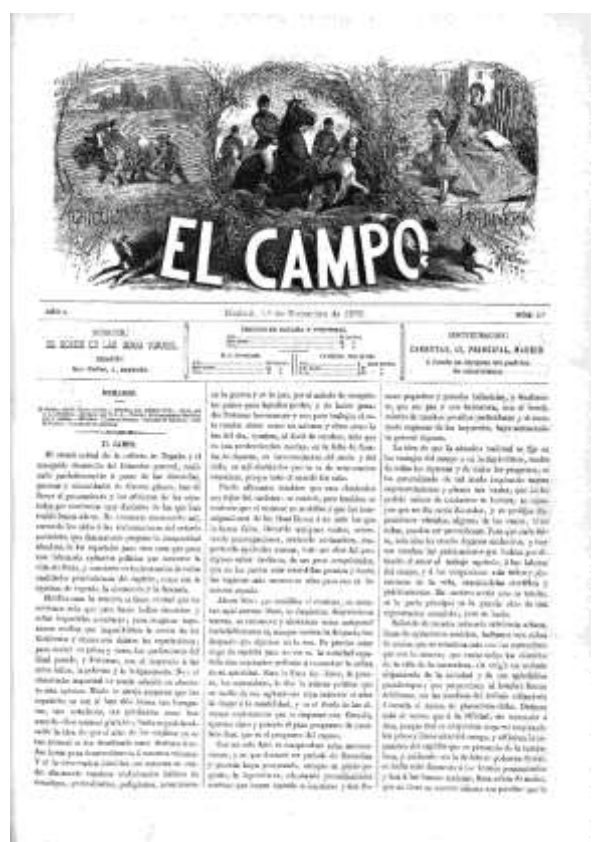
Registro y primera cabecera de El Campo: agricultura, jardinería y sport (01/12/1876). Biblioteca Virtual de Prensa Histórica.