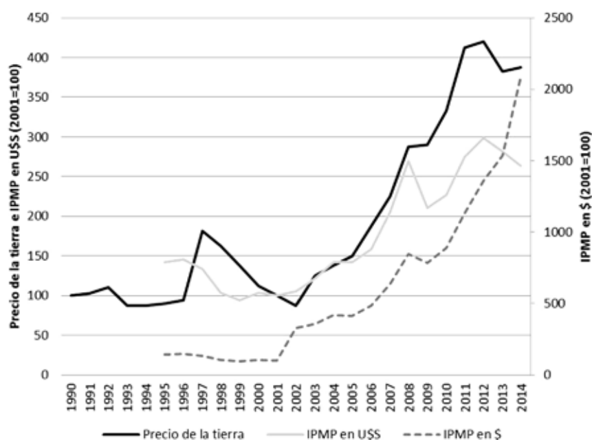
Gráfico 2. Precio de la tierra (región pampeana) e Índice de Precios de las Materias Primas de exportación (IPMP) de Argentina (en dólares y en pesos), 2001=100