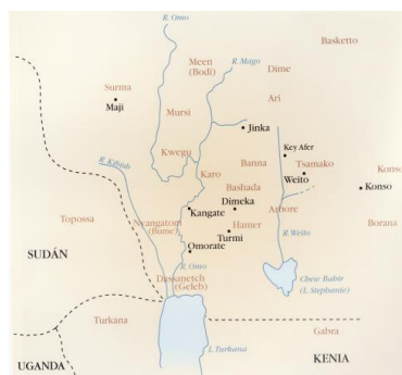
Imagen 2: Localización etnias Valle del Omo

Así mismo, el pastoreo con vacas, cabras y ovejas son parte vital del modo de vida de la mayoría de estos pueblos indígenas, al reportarles sangre, leche, carne y pieles. Las vacas tienen un gran valor y se emplean como pago por la novia cuando va a ser desposada.