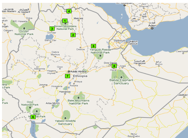
Imagen 1: Localización Bienes patrimonio de la Humanidad