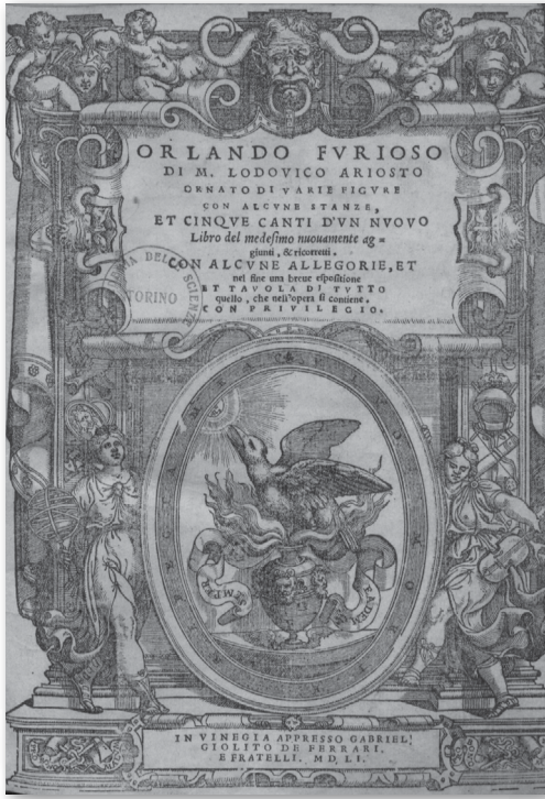
Portada de Orlando Furioso , de Ludovico Ariosto, 1551.

momento de su discurso, pues Angélica lo dejará de ser después—, pero sólo en medio de la naturaleza pueden disfrutar su pureza; la sociedad las señala difamándolas como infieles y desagradecidas. Angélica, hasta este punto, ha conservado su castidad, pero ha perdido el honor por huir y tomar su propio camino: “que siendo vagamunda ya no es casta” ( Furioso , VIII: 41, 8). Marcela, por su parte, argumenta: “No engaño a éste ni solicito aquél, ni burlo con uno ni me entretengo con el otro. La conversación honesta de las zagalas destas aldeas y el cuidado de mis cabras me entretiene”.