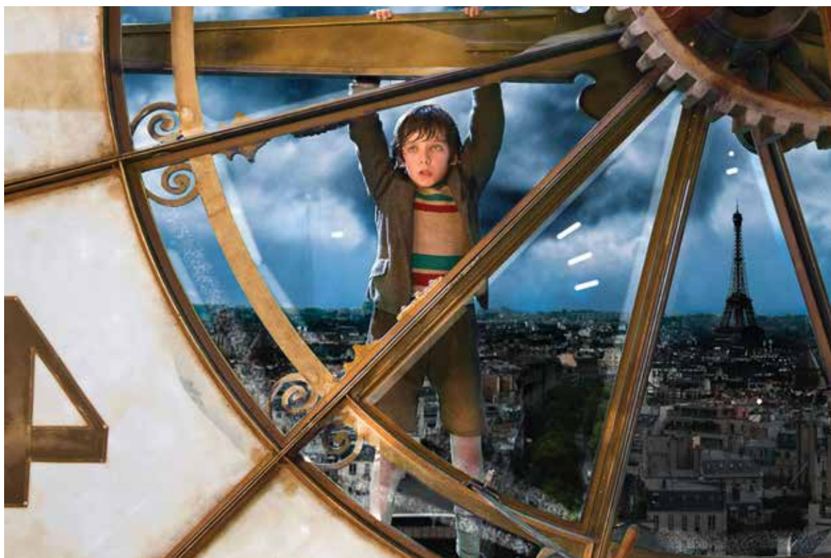
Asa Butterfield en La invención de Hugo .

joyas y vestidos de seda. No veo banqueros, amas de casa o dependientes. No. Hoy me dirijo a ustedes viéndolos como lo que realmente son: sirenas, viajeros, aventureros y magos. Ustedes son los verdaderos soñadores (Selznick, 2010: 506).