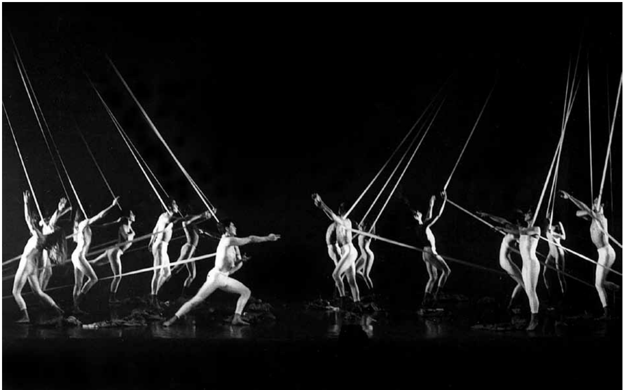
Noche transfigurada (1983), Michel Descombey (coreog.), Ballet Teatro del Espacio.