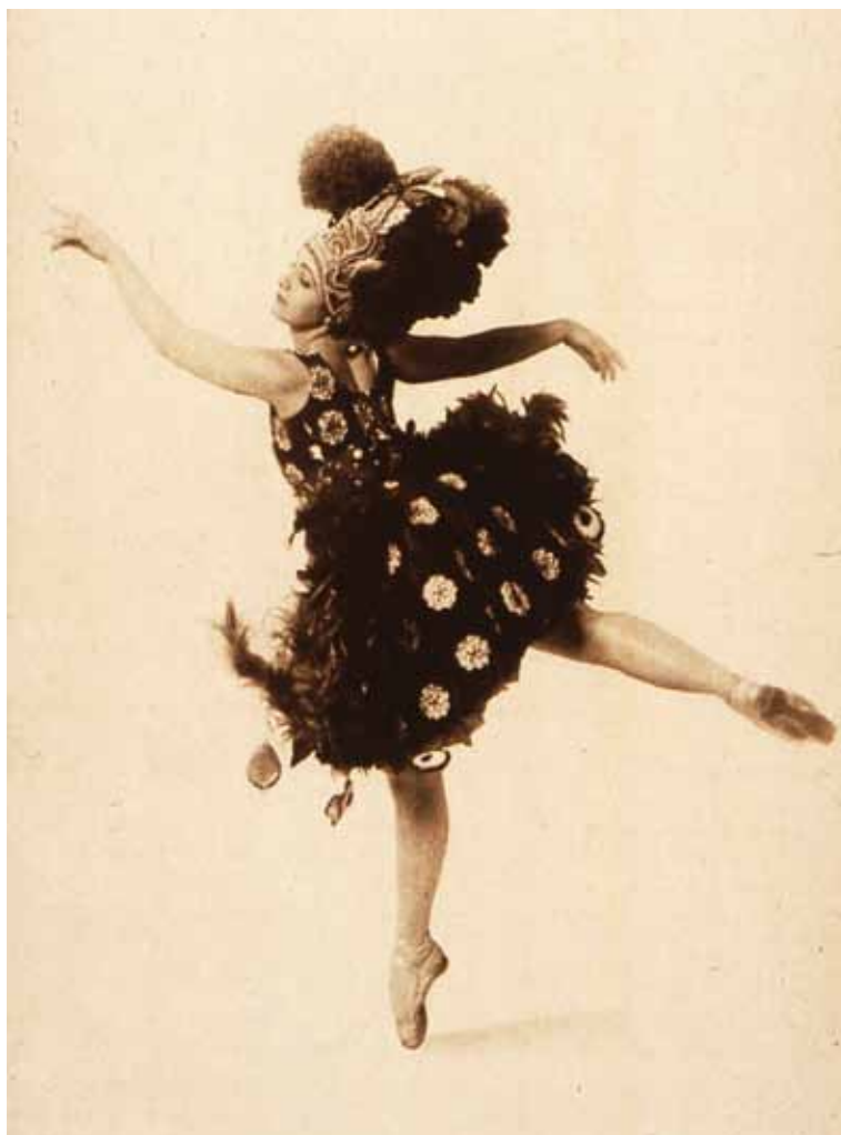
Xenia Maklezowa en El pájaro de fuego (1911), Programa de lujo, Ballets Russes de Serge Diaguilev, Nueva York.

percibir algo de la historia y de la dinámica de ese arte (ancestral) y de sus géneros, así como de la naturaleza de las obras que él contempla. En una palabra, deberá dejarse deslumbrar por el conocimiento de la danza antes que deslumbrarnos con sus fotografías” (Dallal, 1997: 129-135).