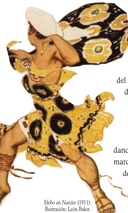
Efebo en Narciso (1911). Ilustración: León Bakst.