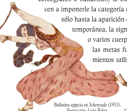
Bailarina egipcia en Scherezade (1911). Ilustración: León Bakst.

cualquiera, siempre que los seres humanos (los coreógrafos o bailarines) le otorguen o alcancen a imponerle la categoría de danza. O sea, sólo hasta la aparición de la danza contemporánea, la significación de uno o varios cuerpos coincidió con las meras funciones y movimientos utilitarios del cuerpo humano, siempre que involucren la intencionalidad en este