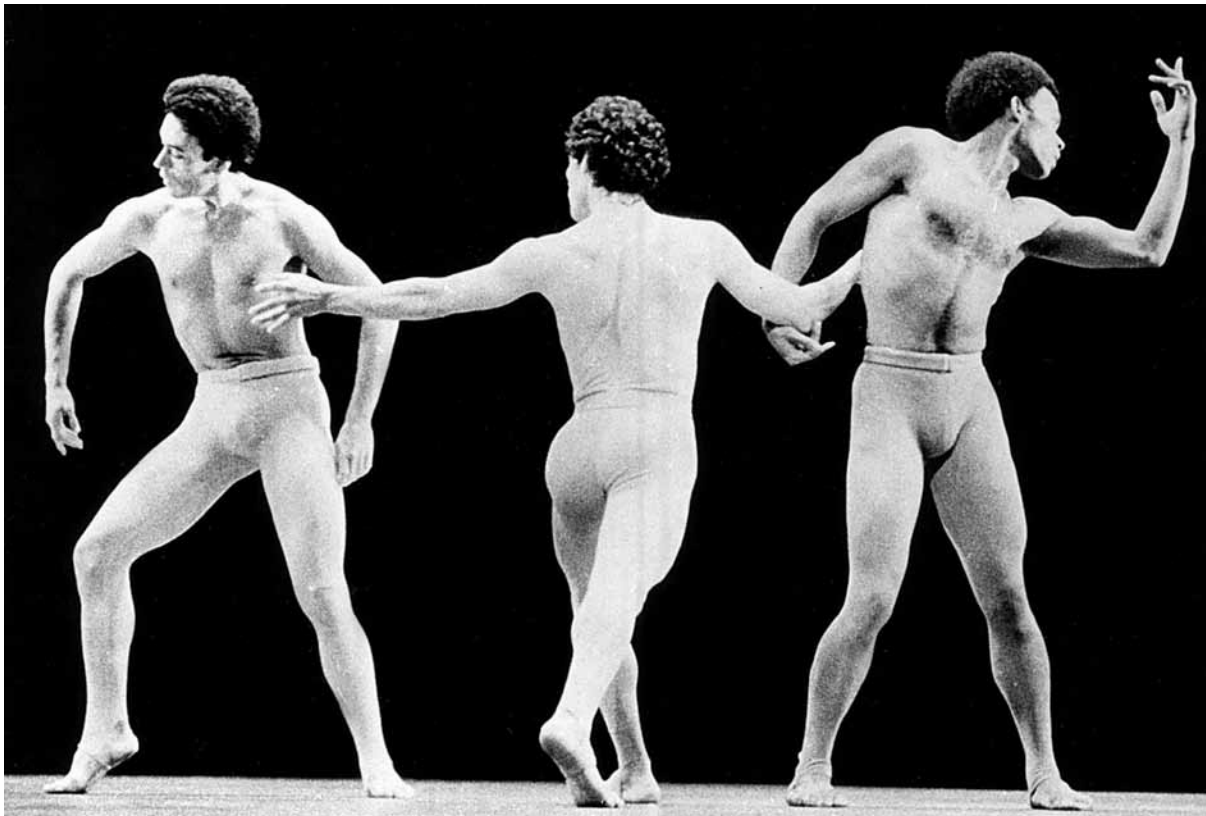
Epicentro (1977), Guillermina Bravo (coreog.), Ballet Nacional de México.