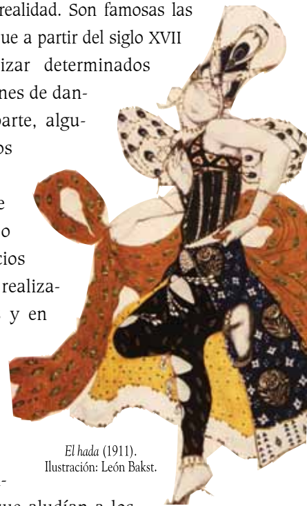
El hada (1911). Ilustración: León Bakst.

Sin embargo, no es sino con la invención de la fotografía que puede reproducirse de manera realista, lo más objetivamente posible, la naturaleza y el desarrollo de los movimientos del cuerpo humano. Desde los primeros productos de esta nueva técnica, los cuerpos humanos y los movimientos que éstos realizaban se convirtieron en importantes vetas de estudio, análisis y expresión. Podemos, asimismo, considerar que en esas fotografías se llegaba a registrar involuntariamente los espacios circundantes, claroscuros, formas diseminadas, nubosidades, escenarios que podían surgir y hacerse atractivamente evidentes durante los procesos de revelado. En este sentido, también es válida la idea de que el acto dancístico es lo más cercano al acontecimiento histórico y social: se crea una estructura hecha de tiempo y espacio, que incluye a los personajes o protagonistas que toman