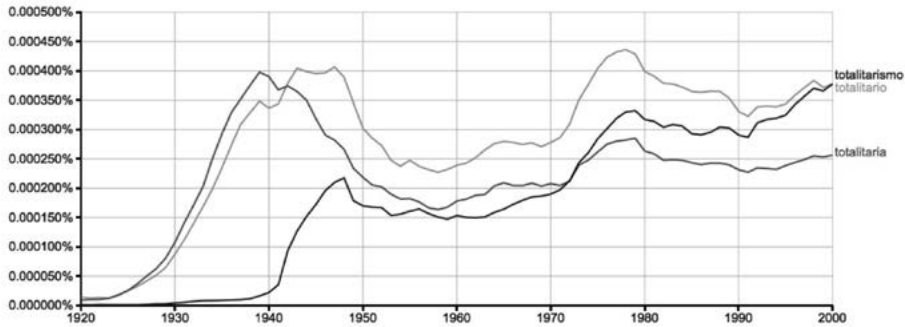
GRÁFICO 2. Uso de «totalitario», «totalitaria» y «totalitarismo» en italiano