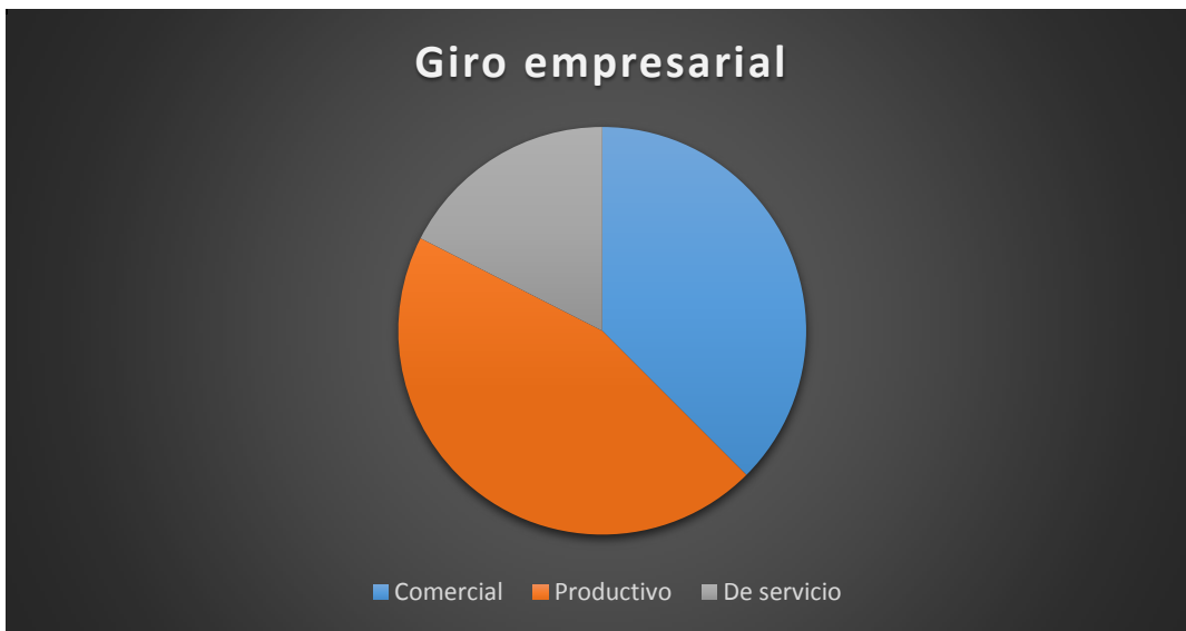
Grafico 2. Giro empresarial

Como lo muestra el gráfico 2, de los encuestados 15 (37.5%) empresas se dedican al comercio, 18 (45%) a actividades productivas y el resto (7 empresas que equivalen al 17.5%) a actividades de servicio, sobresaliendo que las actividades productivas son las que más predominan.