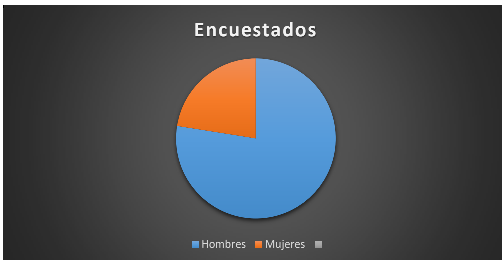
Gráfico 1. Género de los encuestados

Se entrevistaron 40 personas o dirigentes de las empresas familiares, de las cuales el 77.5% correspondiente a 31 personas son del género masculino y 9 entrevistadas que equivalen al 22.5% son del género femenino, de acuerdo al gráfico número 1.