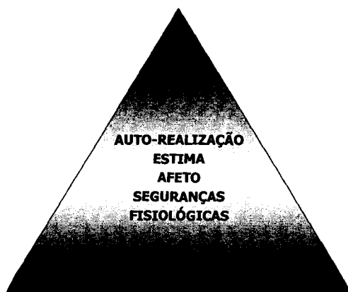
FIGURA 03: HIERARQUIA DAS NECESSIDADES

Neste trabalho, a necessidade é tratada como sendo um déficit ou a manifestação de um