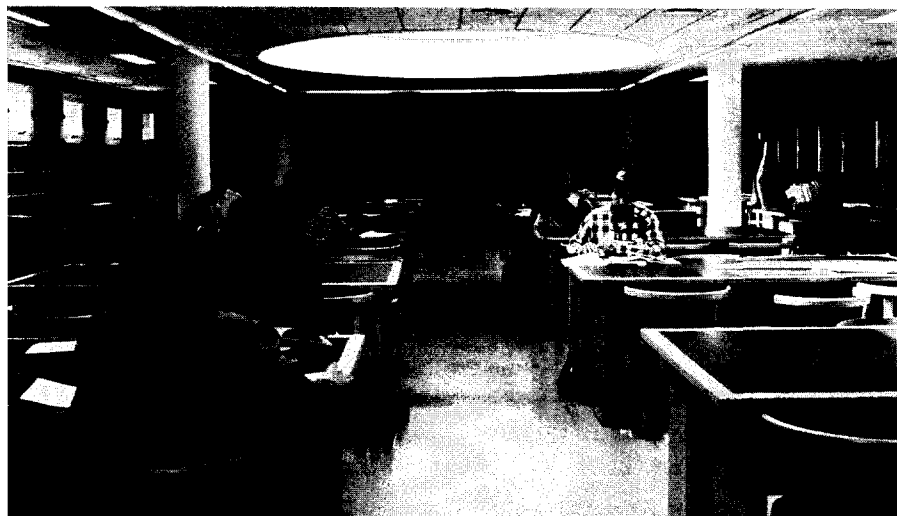
Biblioteca General de Albacete. Sala de lectura.

destacarse como un fondo completo en las materias de derecho y economía el de la Biblioteca de Investigación "Melchor de Macanaz", de Albacete, situada en el Edificio que aloja las Facultades de Derecho y de Ciencias Económicas y Empresariales; o el de ciencias y humanidades de la Biblioteca General de Ciudad Real, procedente de las antiguas bibliotecas de las Facultades de Ciencias Químicas y Letras. A este fondo se ha añadido, en 1993, la valiosa colección particular de Joaquín de Entrambasaguas, formada por 25.000 documentos de todo tipo (monografías, publicaciones periódicas, folletos, hojas sueltas, etcétera) especializados en literatura española e historia y publicados, en su mayor parte, entre finales del siglo XIX y la primera mitad del XX.