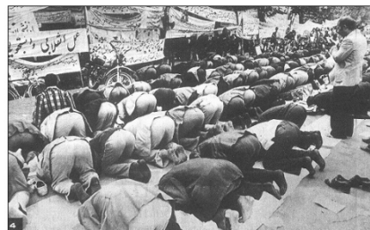
La Vanguardia , 22/11/1979. p. 1