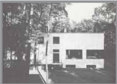
Imagen n.º 3: Casa en Dessau, 1925, Walter Gropius.

Otra forma de demostrar el acercamiento de Peter Behrens al Movimiento Moderno, es observando sus obras de este período, dentro de las cuales sus viviendas unifamiliares son el mejor indicador de esta voluntad de avanzar por el camino que estaban trazando sus ex alumnos, configurando lo que se puede denominar como un atípico caso de retroalimentación positiva en arquitectura. Señalaremos algunos ejemplos de sus ex alumnos de los años 20. Walter Gropius había diseñado la casa en Dessau, en 1925, L. Mies van der Rohe la casa Wolf y la casa Tugendhat de 1925- 27 y 1928- 30 respectivamente y Le Corbusier la casa Cook y las pequeñas viviendas para la exposición de Weissenhof, en Stuttgart en 1926 y 1927, respectivamente.