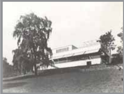
Imagen n.º 8: Casa Tugendhat, 1928-1930, L. Mies Van Der Rohe.