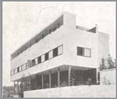
Imagen n.º 4: Vivienda unifamiliar, 1927, Le Corbusier.