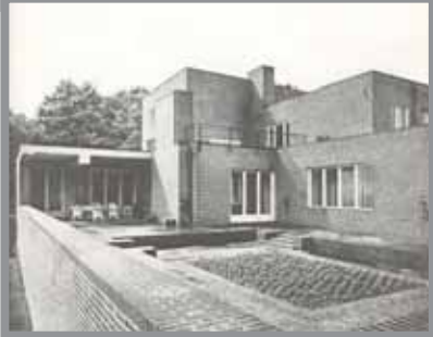
Imagen n.º 5: Casa Wolf, 1925-1927, L. Mies Van Der Rohe.

Imágenes presentadas en la Expo Weissenhof, Stuttgart.