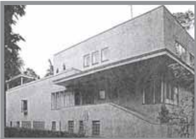
Imagen n.º 6: Casa Kurt-Lewin, 1930. Peter Behrens.