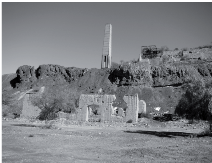
Figura 1. Ruinas del Ingenio Santa Florentina (Chilecito). Restos de construcciones, chimenea, escoriales y estación del cablecarril

En Famatina, en 1902 y 1905 ingresaron capitales extranjeros y compraron las mayores propiedades mineras. De esta manera, Famatina Development Corporation , Compañía Minera los Bayos y Río Amarillo Cooper Company , adquirieron las principales minas como La Mejicana, Los Bayos y Santa Rosa. En estos momentos se instala el cable-carril en coincidencia con la llegada del ferrocarril y la incorporación de nuevas tecnologías de explotación y fundición, como las utilizadas en las fundiciones de Santa Florentina (Figura 1). A pesar de estos nuevos impulsos, muchos problemas no se resuelven y hacia la Gran Guerra se frenan todas las explotaciones y las exportaciones de mineral a Europa.