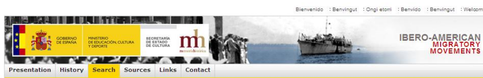
Imagen 4. El Portal de Movimientos Migratorios Iberoamericanos en inglés.

Otro de los aspectos novedosos del Portal de Movimientos Migratorios Iberoamericanos es la incorporación del multilingüismo. Tanto los contenidos, como la información contextual del Portal, están en todas las lenguas cooficiales del Estado español y en inglés (Ver Imagen 4).