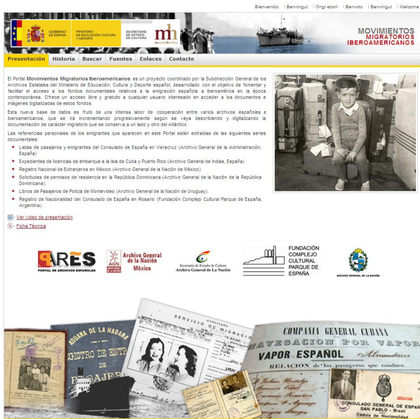
Imagen 1. Pantalla de inicio del Portal de Movimientos Migratorios Iberoamericanos.

Uno de los criterios introducidos para la búsqueda de emigrantes es el género. Filtrando por este criterio, se obtiene como resultado un total de 17.408 mujeres emigrantes en la base de datos, es decir, un 23% del total de personas que aparecen en los documentos descritos. (Ver Gráfico 1).