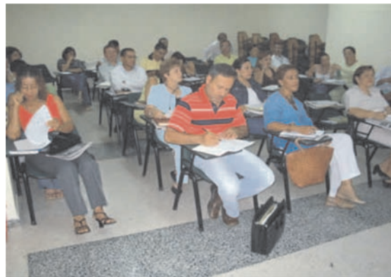
Imágen 1. Valores éticos implícitos como parte de la filosofía institucional objetivos institucionales, visión y misión

Por otro lado, es pertinente hacer notar algunos de los valores implícitos en la población objeto de esta investigación, como por ejemplo, la visión. Si bien esta señala el rumbo adecuado y objetivo de toda institución, también indica la dirección que las estrategias asumidas deben poseer para el logro de los fines. De esta indagación se destaca que la misión expresa la razón de ser de una empresa o institución, pero también de objetivos organizacionales, los cuales como se sabe direccionan el rumbo que los líderes han de tomar para satisfacer las necesidades de la institución, de sus entornos y de los intereses propuestos. En la Imagen 1, tomada en el decurso del estudio, pudo apreciarse que la población siempre estuvo atenta a las directrices emanadas de los directivos para formular algunas estrategias que permitan el cumplimiento de la misión.