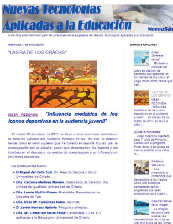
Figura 3. Portafolios de estudiantes de Educación Primaria http://nereasaez-nntt.blogspot.com.es/