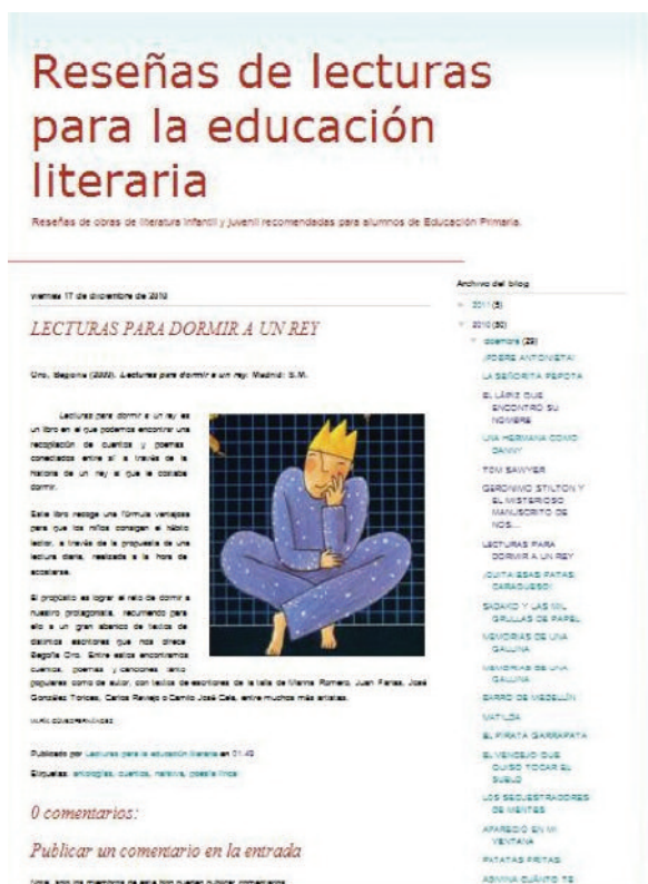
Figura 1. Blog colectivo de los estudiantes http://literaturaenprimaria.blogspot.com/

para la publicación de los textos elaborados por los estudiantes sobre obras de literatura infantil actual que previamente debían leer, para intercambiar información y opiniones al respecto. El blog se alojó en la plataforma gratuita Blogger, apropiada por su facilidad de uso.