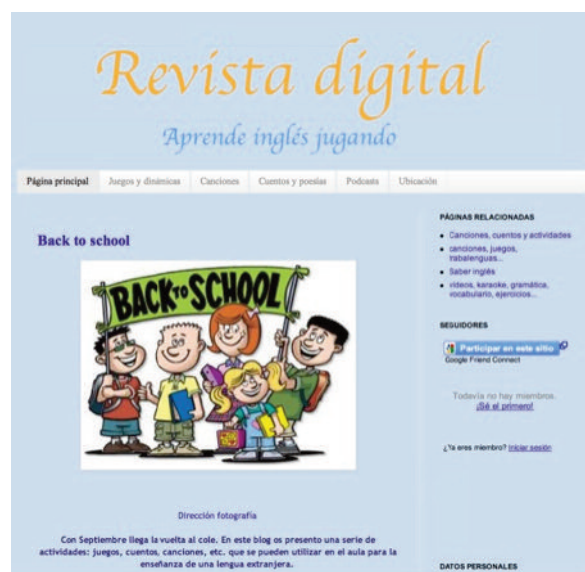
Figura 2. Revista digital creada por los estudiantes

El desarrollo de esta actividad formativa tenía como principal objetivo general cualificar a los futuros maestros para que fueran capaces de incorporar las tecnologías Web 2.0 en el aula desde una perspectiva educativa. A partir de este objetivo general se desprenden otros más específicos: