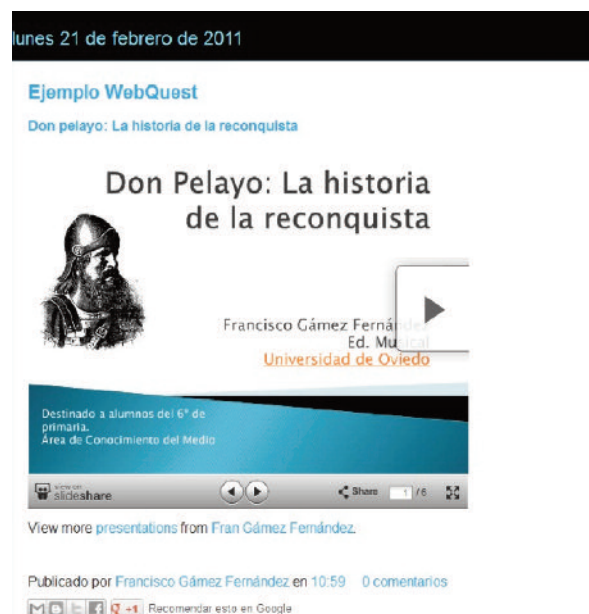
Figura 4. Webquest integrada en el Blog de un estudiante http://franciscogamezf.blogspot.com.es http://www.slideshare.net/Ferga88/don-pelayo-la-historia-de-la-reconquista?from=ss_embed